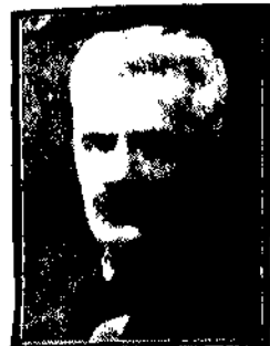
znakomity powieściopisarz zdobył 25-letnią pracę pisarską