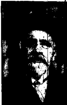
profesor Sorbony Jean Perrin otrzymał z rąk Nobla nagrodę za prace z dziedziny fizyki