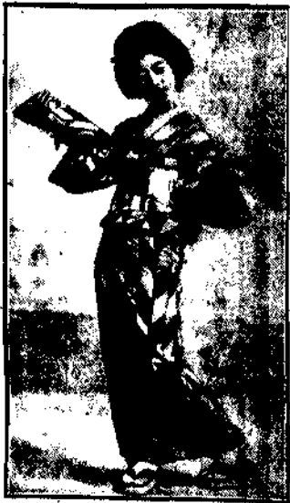
dawna gejsza, jedna z najpopularniejszych aktorek filmowych japońskich.

Prześladował ją na każdym kroku, chodził za nią w trop, domagając się, by powróciła do mieszkania, które wspólnie zajmowali.