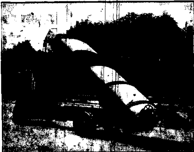
Smalcziarka najnowszej konstrukcji.