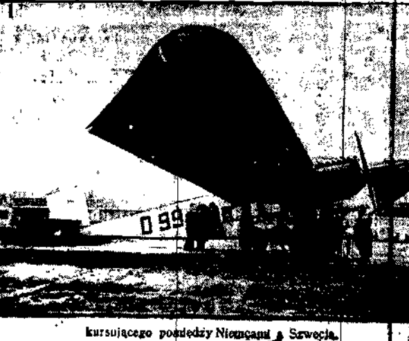
kursującego pomiędzy Niemcami i Szwecją.