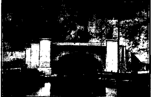
Jest to najdłuższy na świecie kanał podziemny który łączą Spis i Marsylię z Rodanem