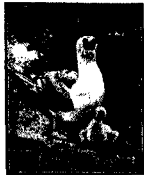
Rzadka odmiana białej jaskółki morskiej z piskletami