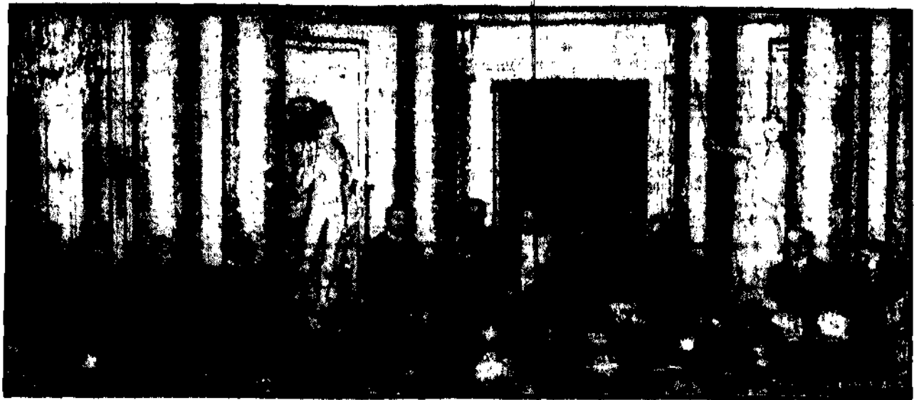
Przewodniczący Rady Ministrów odczytał akt otwarcia sejmowej w obecności członków rządu i premiera Piłsudskiego, oraz posłów i senatorów. (Patrz str. 2-4).