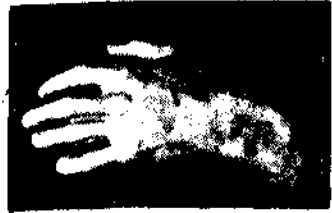
REKA MISTRZA TONÓW

wszechogarniająca skala wzruszeń od radośnych hejnałów życia, wy-rażonych w Polonezie i as-dur do niesamowitej poezji śmierci, biją-cej z akordów Marsza Żołnierskiego. Na tym najwspanialszym łuku (twórczości chopinowskiej) usładło-rajskie plectwo i serafidowe śpie-wa melodie. Są to nasze ukochane mazurki, preludia, nocturny. Nieśmiertelny mistrz wypowlewał w nich całą symfonię duszy polskiej, tej, która była, jest i po wszystkie-czasy będzie — od zdeptanej tonacji piastowskiej do współczes-nej, tak ciężko, tak młotnie wcie-lającej się w nieśmiertelny akord harmonii. Dziś stolica składa hołd Fryde-rykowi Chopinowi. Przybyli ze wszystkich stron Europy najznakomitsi przedsta-wiciele czcili dziś będą przed pom-nikiem Chopina wieczysto źródło na-szej twórczości i sławy. Dziś, jak rzadko kiedy, wobec całego świata możemy być dumni i wzruszeni.