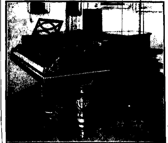
FORTEPIAN, NA KTÓRYM TWORZYŁ CHOPIN

„Krzyżacy”, której treść osnuta jest na tle powieści historycznej Henryka Sienkiewicza. Zanim dzieło to ujrzy światło