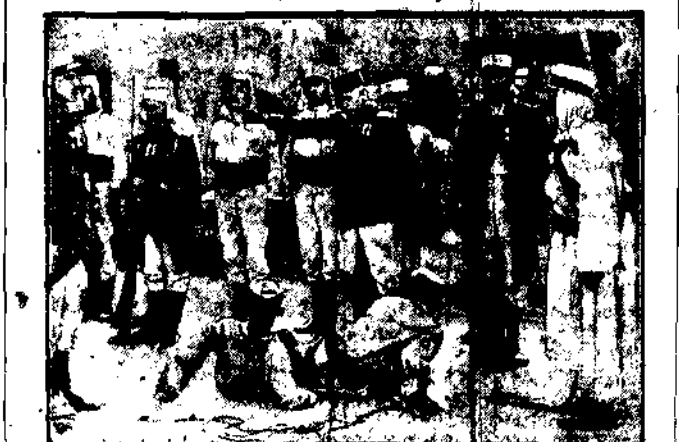
Pomimo protestów francuskich polityków kinematografy amerykańskie wyświetlała obraz film p. t. „Francuska legja cudzoziemców”. Wielka sensacja.