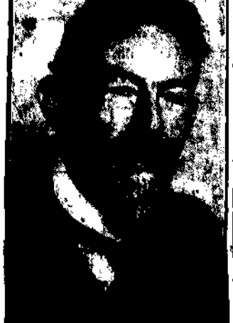
chemik, który otrzymał obecnie nagrodę Nobla.