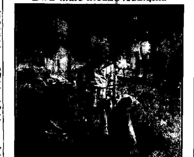
Przybyły na świat w berlińskim ogrodzie zoologicznym. Dzieci bawią się z nimi bardzo chętnie i uważają je za żywe lalki.

A tymczasem Mussolini rozpala dalej wyobraźnię Włochów mowami, w których wskazuje na konieczność opano-wania Morza Śródziemnego przez Włochy i zdobyciu no-wych kolonii w Afryce i w Azji Mniejszej. W jednej z mów oświadczył, iż musi przywrócić Włochom potęgę militarną i terytorjalną dawnego imperjum rzymskiego. Wywołało to przykre echo przedewszystkiem we Francji i Hiszpanji. W wywiadzie udzielonym dziennikarzowi amerykańskiemu oświadczył Mussolini: — Powtarzam historję cezar-ów rzymskich. Wielkim przy-kładem dla mnie jest Juljusz Cezar. Statwę jego mam zawsze przed oczyma... I Mussolini pokazał korespon-dentowi statwę Juljusza Cezara, ustawioną nad biurkiem. Prasa zairaniczna podkreśla, iż w dyktatorze Włoch jest mniej Juljusza Cezara a więcej Kalkuli i przepowiada państwu włoskiemu gętkie wstrząśnienia, jako prosty rezultat autokratycz-nych rządów, sprawowanych bez kontroli parlamentu, za po-mocą krwawego gwałtu i tero-ru.