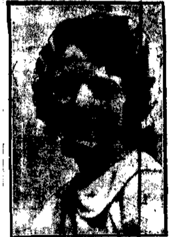
Arabela nowa gwiazda filmowa Janet Gaynor z Fox-Film.