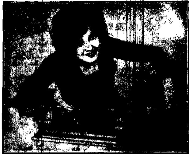
Zbudowany własnoręcznie przez Edisona, tak wyglądał.