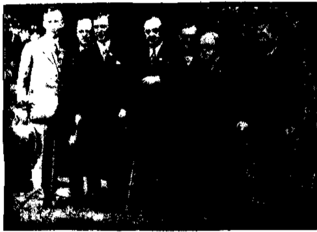
Brana bankierów kalifornijskich reprezentujących kilka bilionów dolarów.