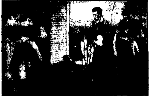
urodzila krowa w Holandji, razem waza ona 86 kilogramów.