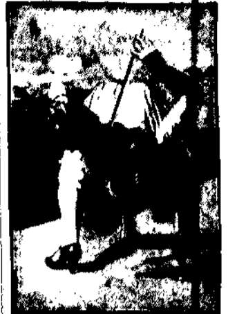
Znana skrzypczka kalifornijska, Sally Marsh, może grać w każdej sytuacji