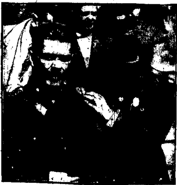
Wojna opanczy na rycerza, kłosa marynarci amerykańskich.