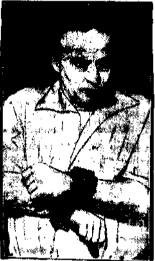
Harry Houdini, zmarł w Detroit w Ameryce, pokazywał on niezwykle sztuki mając ręce skute kaidankami.