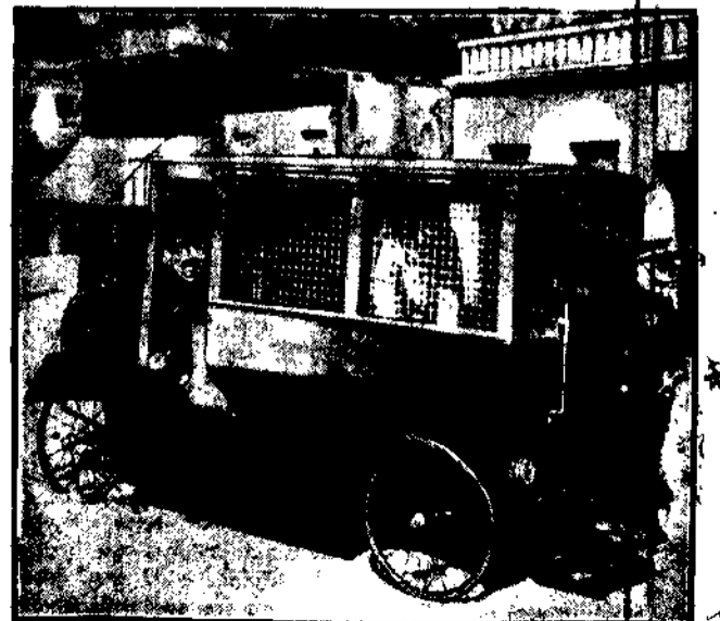
Patrol policyjny na samochodzie w interpretacji autorów — m.