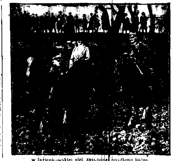
w łańcuchowej alei, zasypianej opadłami liści.