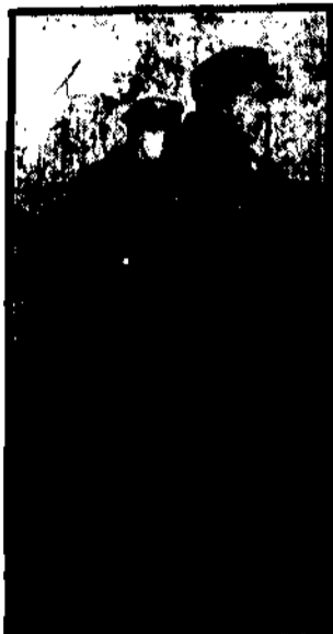
Wieczny niepokój niecałkowicie uspokoił wczoraj w batalionie sanitarnym na Powązkach.