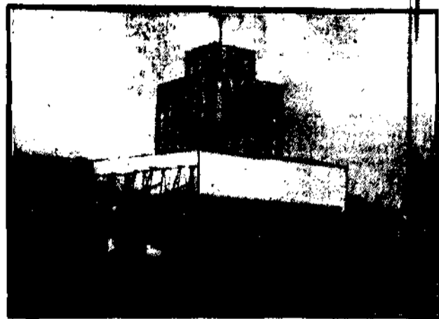
Główny pawilon na placu Saskim.