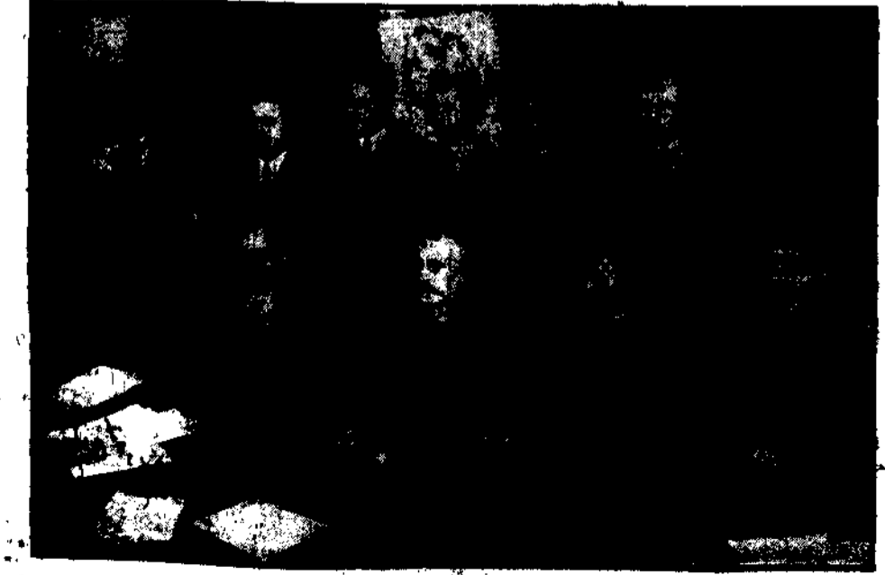
Pierwszy zjazd anatomów i zoologów w Warszawie...