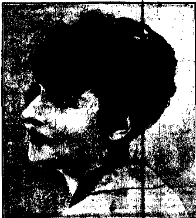
detekł której chłopczycy wygląda jak przedwójna kobieta