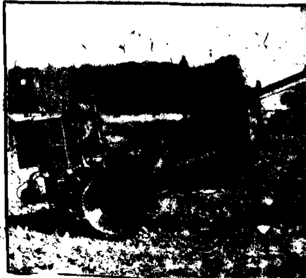
Nowy typ pluga-samochozu, wprowadzony do Francji