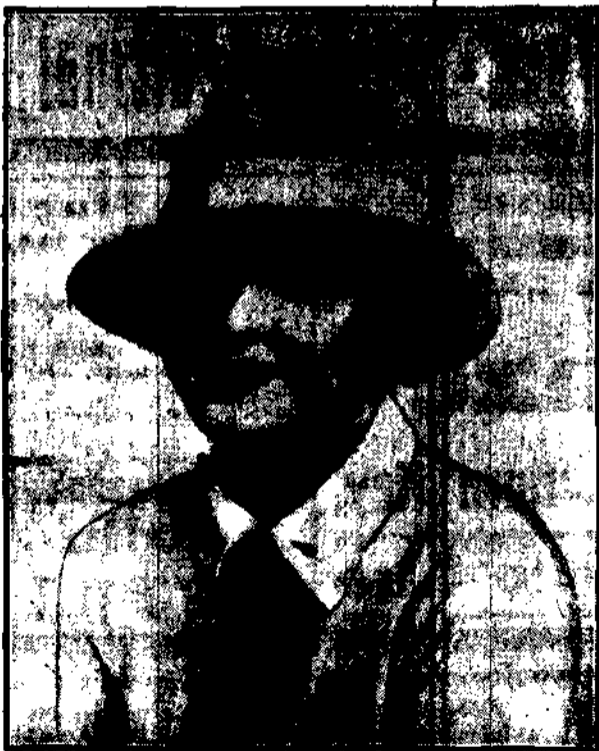
Wiedeńska aktorka kinematograficzna, postanowiła odbyć podróż samochodowym naokoło świata.