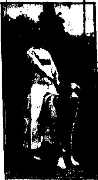
Stylna sukma, postępowe i wielkim Bernardem jak małe dziecko — niezdziwnię na nim