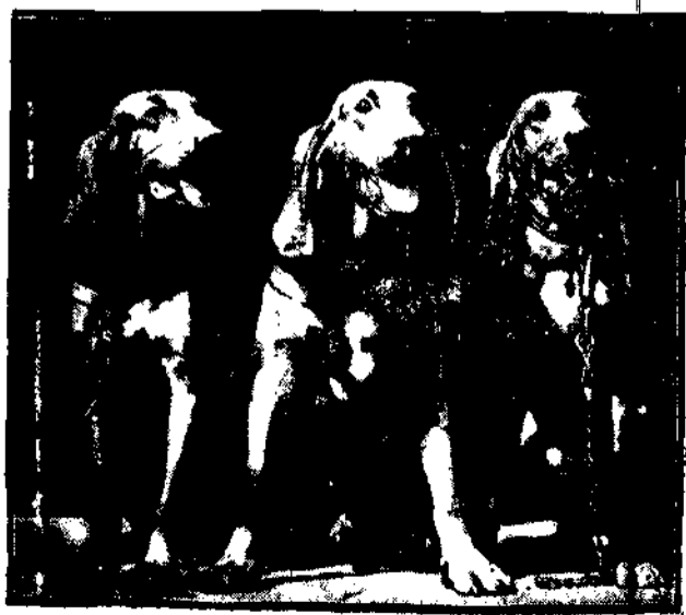
Psy, które w filmie „Chciała być Tonia” zagrały rolę główną, siedzą w klatkach