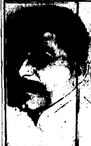
z pochodeńcia chłop gruźliki i nazwiska Dżugaszwili, oddał zwycięstwo nad opozycją Zinowiewa i Trockiego.