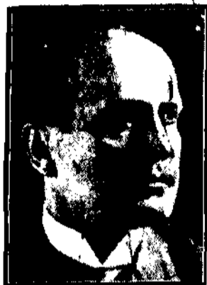
BENITO MUSSOLINI na którego życie wykonano znowu zamach.