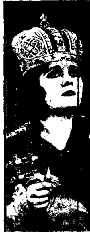
Niebawem ukaże się na ekranach europejskich obraz pod tym tytułem. Rolę główną odgrywa Pola Negri.