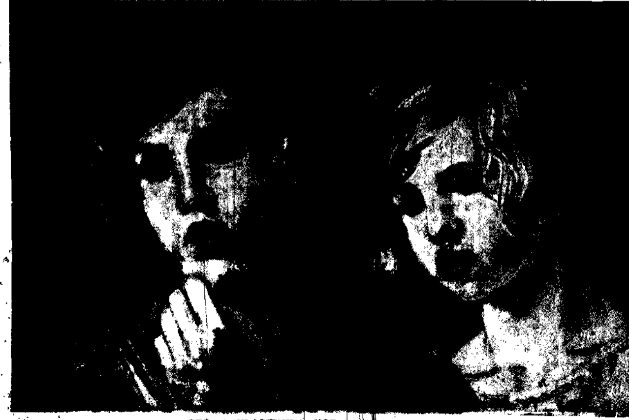
OBRAZ WLASTIMILA HOFFMANA