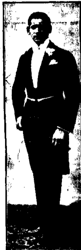
Dobrze skrojony nowoczesny frak.