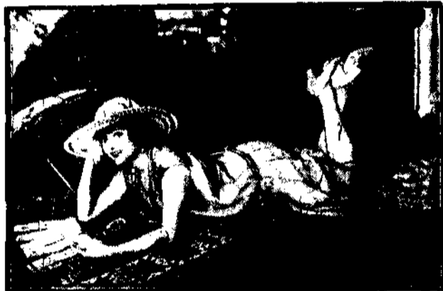
Malgorzata Salva, która uchodzi za najlepszą odwroczytnie Carmony, występowała już w tej roli 350 razy