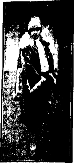
Złoty płaszcz aksamitny z połecymy obramowaniami białych lisem