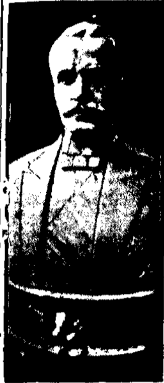
Prezydent Rzplitej Ignacy Mościcki

Dzisiaj upływa Konstytucyjny termin ogłoszenia dekretu o zwołaniu Sejmu