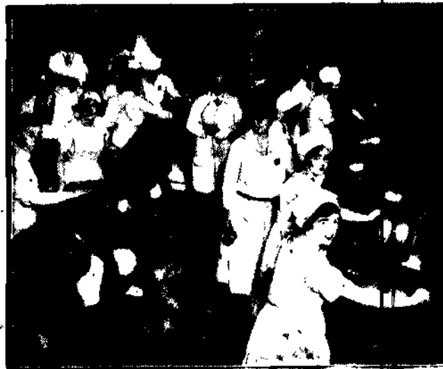
Najnowsze maszyny do fabrykacji masła.