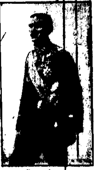
Gen. bron Zygmunt Zieliński

Wobec Pańskich swądzeń, polegałoby na tym, iż nie wystarczył Panu czasem do wydania zarządzeń, związku z tym, iż w dniu dzisiejszym o godz. 5 po południu, to za Pańską poradą omawia zarządzenia moje z d. 29 b. m. o otwarciu sesji sejmowej o czym również zamawiam natychmiast Pana Marszałka Sejmu, z tem, aby zarządził Pan, jak i Pan Marszałek Sejmu zachęcał porozumieć się pomiędzy sobą, co do szczegółów i terminu uroczystości otwarcia Sejmu. Oczekując od Pana zarządzenia w tej sprawie łączę wyrazy wysokiego poważania. (-) I. MOSCICKI.