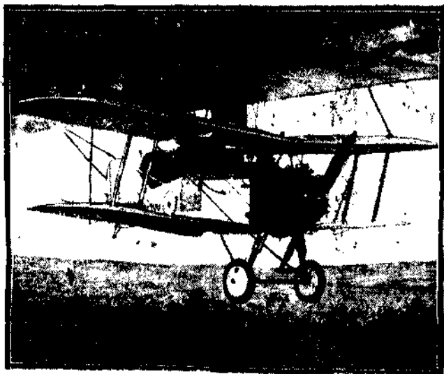
Wielki sterowiec z przymocowanym pod nim aeroplanem pomocniczym.