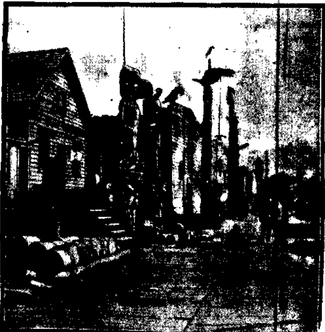
Przed domami "Indyan" - dziewczynki Indian.