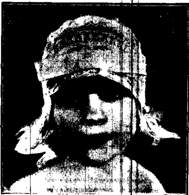
Noszą je już panie w Paryżu i Wiedniu. Model, którego fotografie umieszczamy, jest zrobiony z białej koronki i prz. opasany różową, jedwabną wstążką.