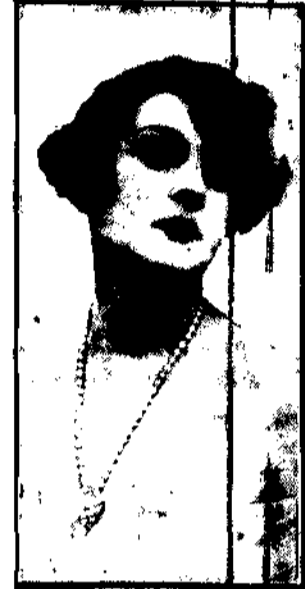
zwłaszcza na tak pięknej szyjce