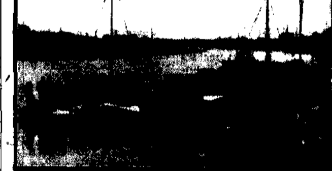
W niedzielę przy wyjeździe Kościuszkowskim w Warszawie, odbyła się uroczystość podniesienia bandery polskiej marynarki wojennej na Złotym Monitorach „Jaskółka” i „Włosek”, wykonanych w stoczni L. Zieleniewskiego.