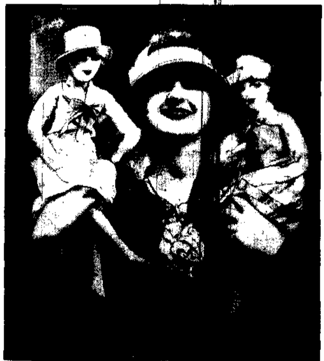
Największym szaleństwem w Londynie jest wiozienie kobiet w takich jak w obrazie strojach.