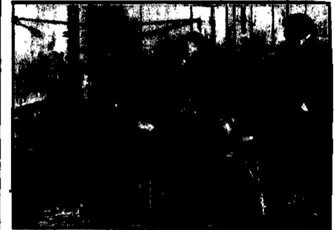
na ul. Jagiellońskiej ci, którzy się spóźnili