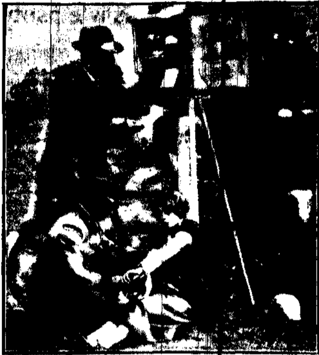
Wobec nieustających katastrof samochodowych urządzono na szosach angielskich stałe ambulanse.