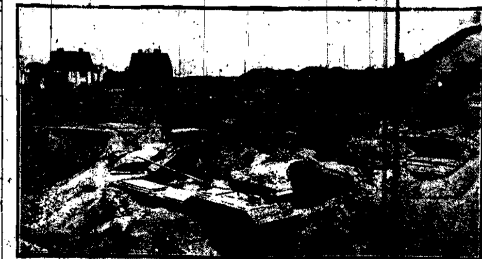
Rozbiórka fortów Cytadeli warszawskiej, zwany postępuje naprzód. Kamień za kamieniem nie zostanie z tego pomnika niewoli moskiewskiej.