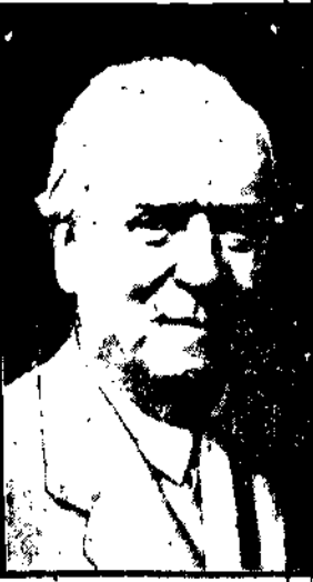
ASQUITH postanowił wycofać się z życia politycznego