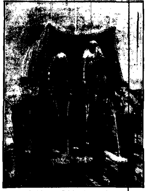
W Ameryce skonstruowany alkohol wylewa się bezceremonialnie.