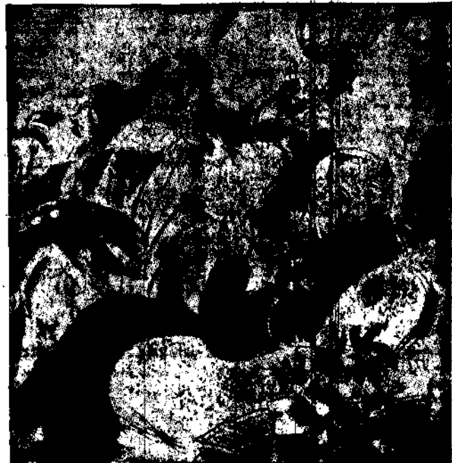
Przed laty coś czterdziestu W słodkich wzmruszeń chwili, O serc swych diagnozile Sam na sam mówili. Dzisiaj znów o sercowej Gwarze diagnozile: Ona — o otępieniu, On zaś — o szerozile.