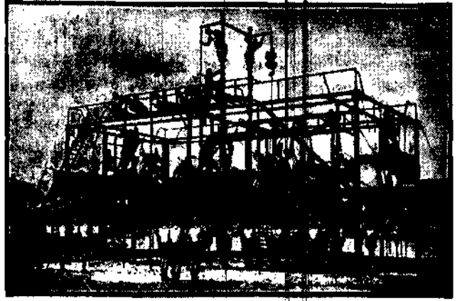
W jednej z niemieckich szkół policyjnych ustawiono olbrzymi przyrząd do gimnastyki, na którym stał każdy może ćwiczyć się jednocześnie.