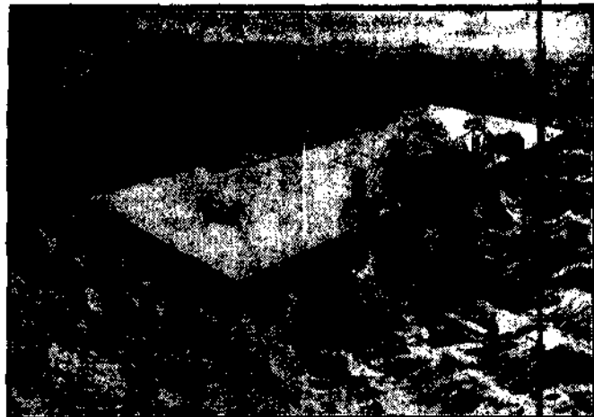
Dla ułatwienia komunikacji lotniczej pomiędzy Ameryką a Europą, ma być obudowany port lotniczy z odleg. powyższego rysunku.