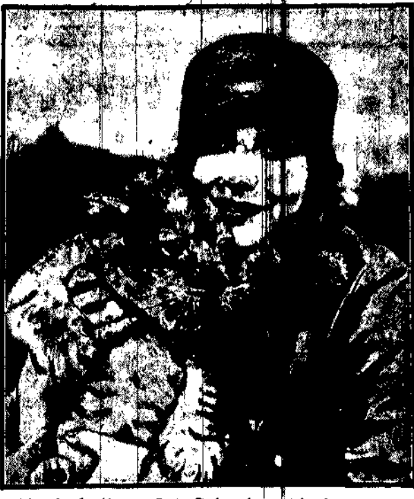
Szwedzka aktorka filmowa Greta Garbo, nie posiadała się prawie nigdy z młodym lwem.