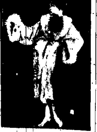
Młodzi oparli do siebie obramowany szlafroczek tworzą miłość.