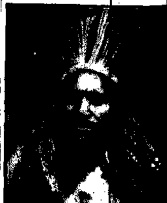
HAMOJI wynaleziony niedługo na wyspach australijskich