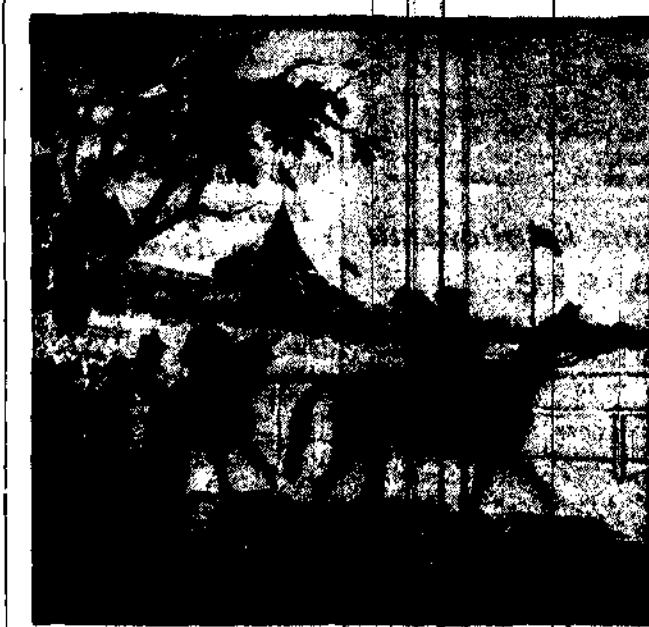
Brzęknął dzwonek. — Już młkła tonie przez zionone wielkie błonie. Gracz się trawi, ktoś w pedale Pierwszy do mety przystąpił?