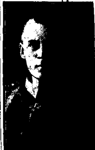
SINVO AARNE mianowany generalisimosem Finlandii