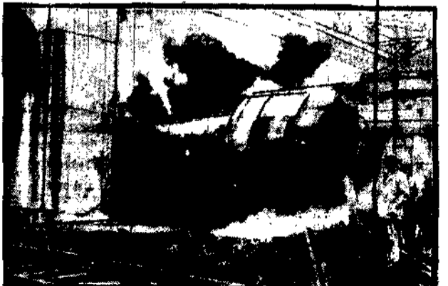
Na niemieckiej stacji Lebnitz wykolejona lokomotywa rozbijała się o barierę.