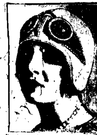
Kapelusz w kształcie hełmu lotniczego wprowadzony na modę przez projektantkę przez ocean Atlantycki