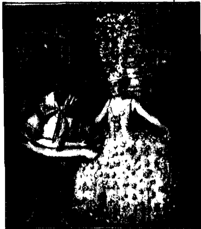
Zawsze uroczy i pełna temperamentu artystka paryskich kabaretów Mistinguett wyjechała do Niemiec, gdzie rozpoczęła w swoim stylu propagandę artystyczną. W obrazie widzimy ją po lewej stronie, po prawej stronie niemiecka Terese Hesterberg.