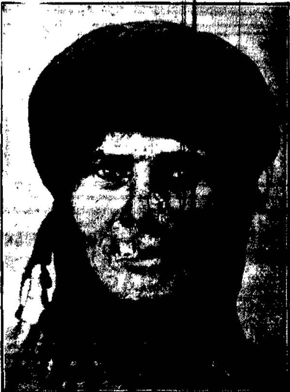
Włoszanka pustyni arabskiej, która nie może przystąpić do kościoła, nosi ten nos, który jest jej jedyną ozdobą.