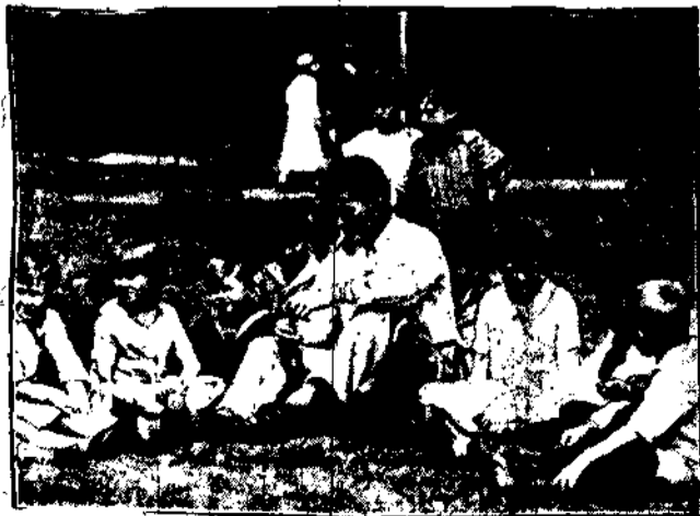
Boxer Finney bardzo chętnie przyszedł w towarzystwie dzieci i opowiada im o swojej bajce.