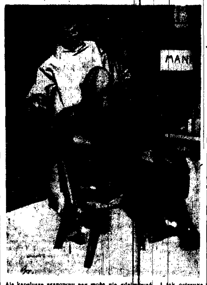
Ale kapelusza szanowny pan może nie zdejmować... i tak ostrzygę.

mać podczas napelniania zbiorników samochodu benzyna, zastrzelili stróża nocnego i ranili dwie inne osoby. Nieco później ci sami bandyci obrabowali i zabili dwu marynarzy. Cała policja St. Francisco została zmobilizowana. Po mieście krąży patrol policyjny w samochodach. Prócz policji w pościgu biorą udział mieszkańcy San Francisco uzbrojeni w karabiny i rewolwery. Aresztowano cały szereg osób w podejrzanych dzielnicach. 360 z pośród aresztowanych osadzono w więzieniu.