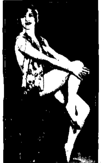
Lisetta Rush po przepłynięciu kanału Panamskiego została zaangażowana do kinematografu.

Przez kanał Panamski na ekran kinematograficzny