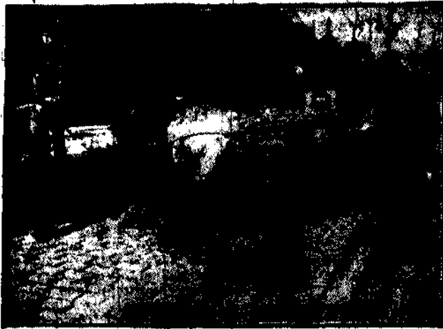
ZNISZCZONE ULICE bez odnowienia starego bruku pokrywa się grubą warstwą asfaltu.