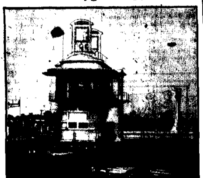
Budka sygnalizacyjna najnowszej typu na francuskich kolejach