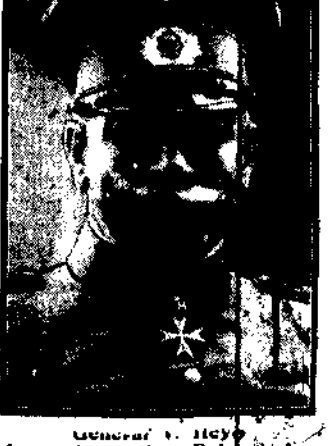
obecny komendant Reichswehry