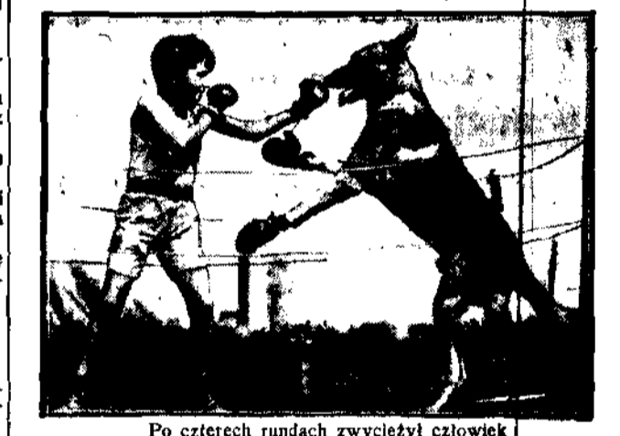
Po czterech rundach zwyciężył człowiek