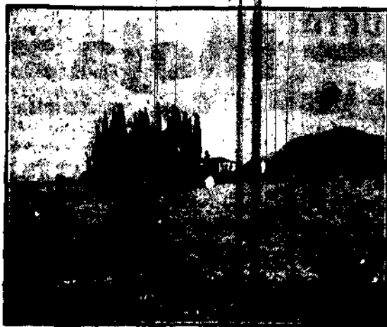
Wielkonoce obrazem Böcklina małej wyspki „Ponticonisi”, zwanego w całym świecie jako „wyspa umarłych”, przedstawiona z powodu krępowania się jej skalistej góry.