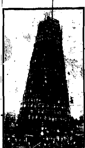
W Bostonie zbudowano wieżę z beczek, nie używając żadnego materiału.