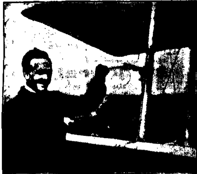
Na wszystkich nowoczesnych samolotach francuskich znajduje się warty aparat, który automatycznie ostrzega pilota o każdym skrzywieniu aeroplanu i w ten sposób umożliwia w znacznym stopniu spokój lot.