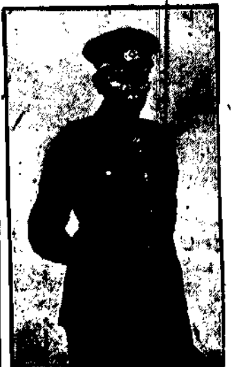
komendant niemieckiej Reichswehry w dymisji