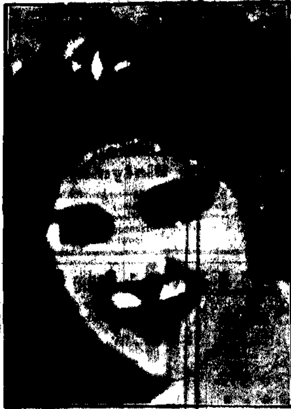
Piękna Amerykanka Gladys Hulette zdobyła sobie wielkie uznanie jako od-twórczyni głównej roli w filmie: „Oczy, które się rozwarły”