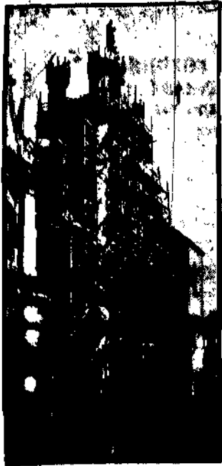
Przemysłowy teatr sztuki politycznej z siedzibą w Warszawie