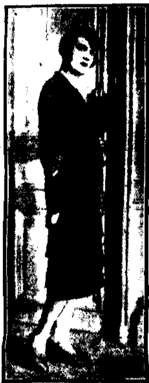
Zawsze elegancka, zawsze jest modna sukienka z czarnego jedwabiu, ozdobiona drobną plisowaną falbanką, złoczeniem ręczną meretką. Wzbiłszy zakochany rekaw jest ostatnią nowością sezonu.