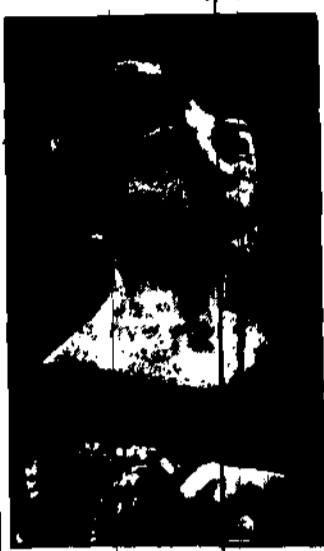
to bohaterki film p. „Światowa kobieta”.