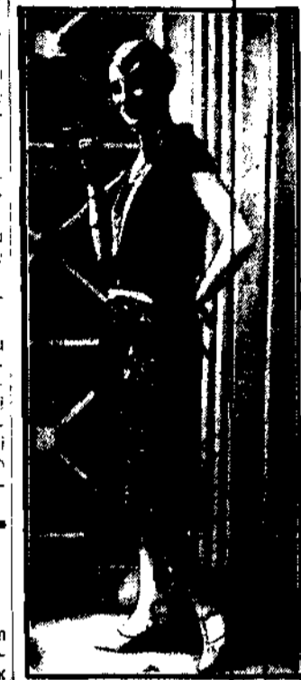
Wytworna sukienka wieczorowa z czarnej koronki na tle złotej lamy. Kamień z białego jedwabiu i długie filczki z aksamitu czarnej udują tej sukni oryginalny charakter damsko-męskiego stroju wieczorowego.