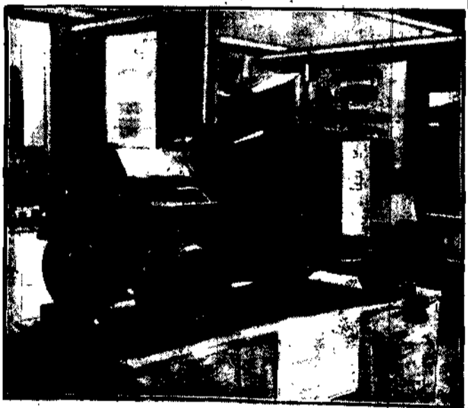
Model pancernego samochodu, skonstruowanego specjalnie do pościgu przestępców.