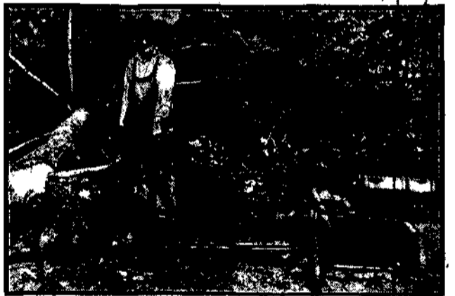
W Ameryce wynaleziono specjalną maszynę do ścinania drzew. Jest ona w stanie powalić drzewo o średnicy jednego metra w przeciągu 17 minut.