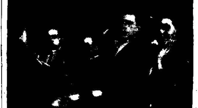
Na ławie oskarżonych znalazł się cały szereg osób, które brały udział w krwawym procesie w Kaliszu.