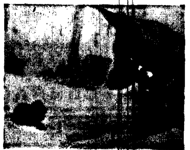
Wławiorka zbiera orzechy pod czujnym dozorem przyjaciela — po