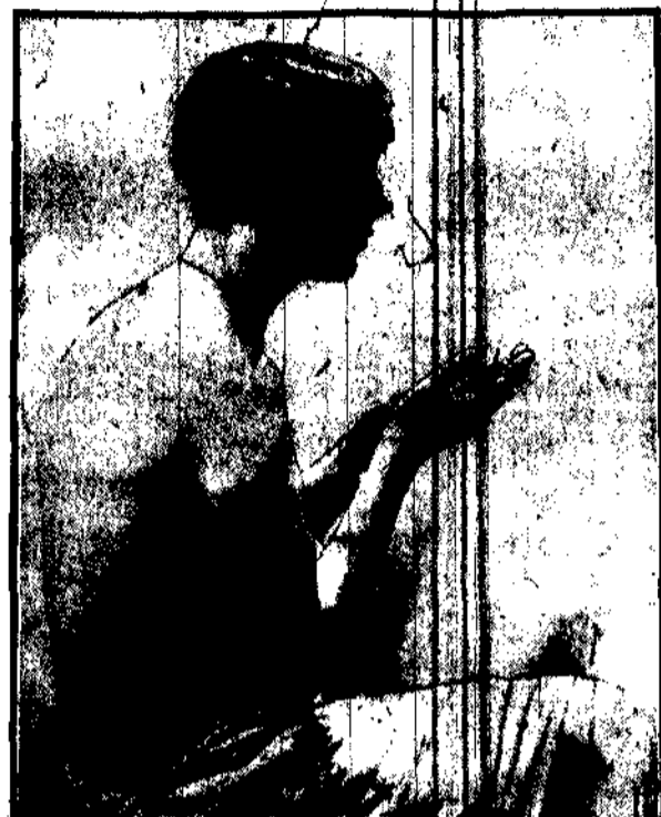
Duńska modelka, która pozuje pewnemu rzeźbiarzowi codziennie przez 8 godzin