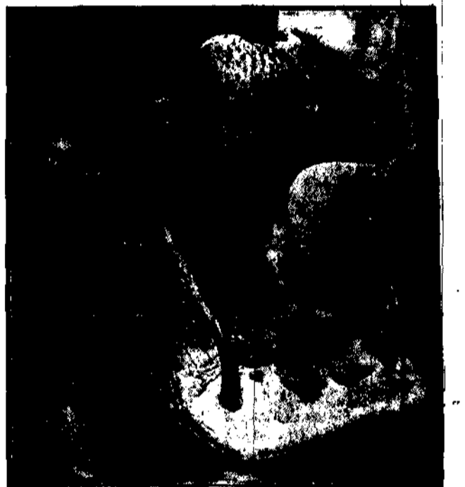
z londyńskiego ogrodu zoologicznego domaga się oszczędnej białej