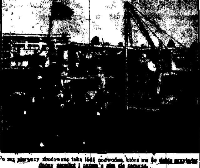
Po raz pierwszy sbudowaną taką łódź podwodną, która ma do siebie przyłączone aparaty sterujące i samą w sobie silniczkę