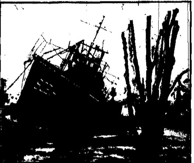
Statek, zrzucony przez orkan na wybrzeże morskie we Florydzie