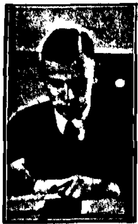
Minister plenipotencyjny w Rydze Juliusz Łukasiewicz, wyszedł do Rygi, dla objęcia nowego stanowiska.