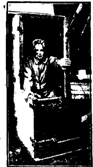
W którym zamknięto na czas dłuższy lub krótki przestępców w XV wieku.