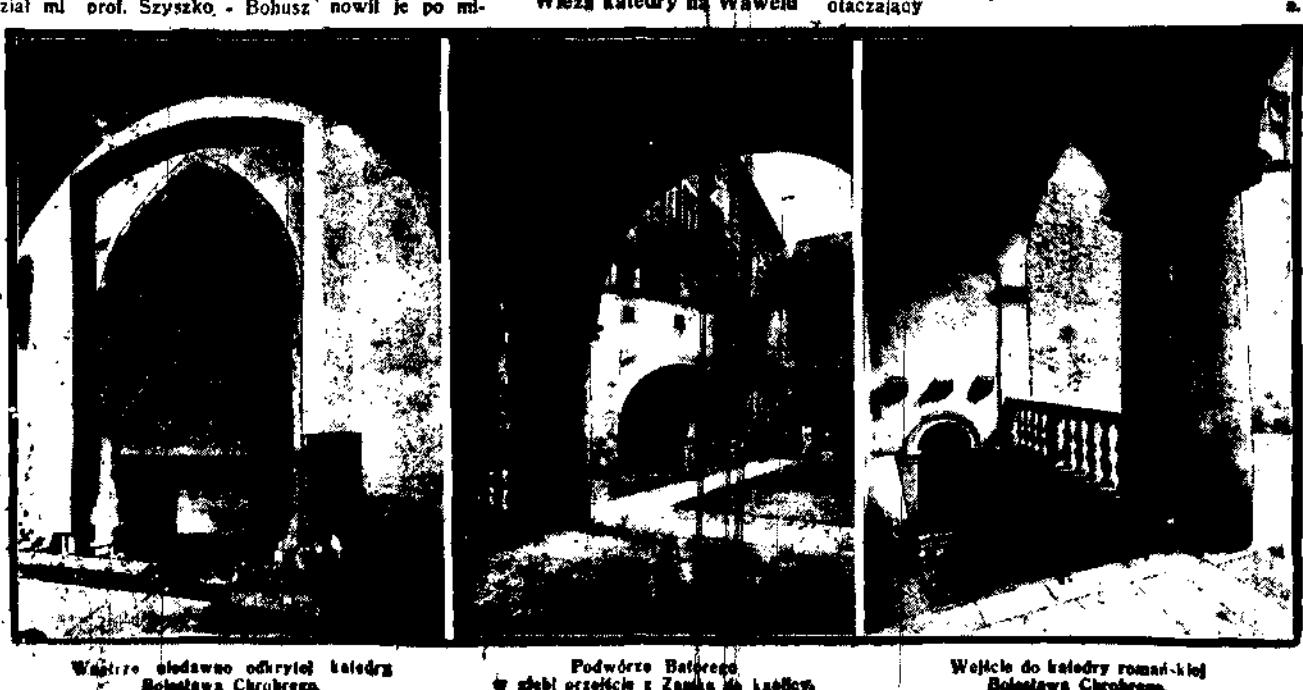
Wieża katedry na Wawelu. Wawel, dawno odkryty katedry Bolesława Chrobrego. Podwórze Białego w głbi przebiega z Zapska do Łupki. Wejście do katedry romańskiej Bolesława Chrobrego.

Kto nie widział Wawelu od czasów austriackich. Jedyne ślady wewnątrz były grubo zamazane smołą, a pod zamurowaniem kruczkami rozlegała się głoszna. echem komenda: „rechts! — links!” ten z wyjątkiem wzruszeniem wstępować musi na wzgórze wawelskie, aby pokłonnie się prosił królów, „potępić, podumać nad pomnikiem sławy”.