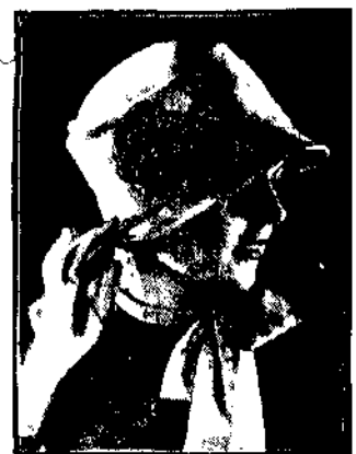
Białe tło, czarna tytuł.