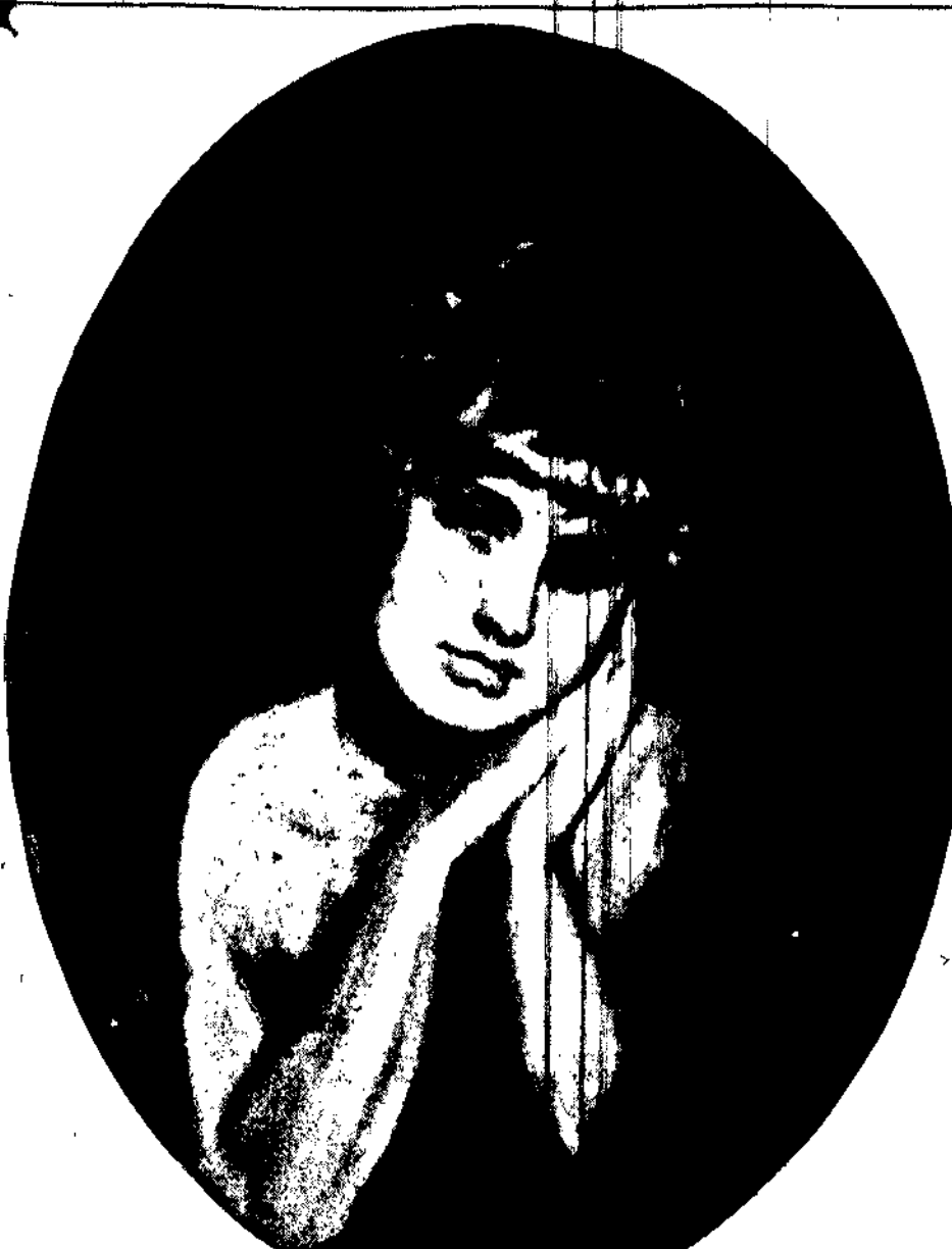
KOBIECA GŁÓWKA K. Mordasiewicz Z salonu sztuki J. St. Węglorkiewiczza

Produkcja niższych gatunków tytoniu w Polsce wzrosła z roku na rok. Tak w latach 1919-1921 produkowano przeciętnie 106.500 kg., w latach 1922-1924 około 600.000 kg. W roku zaś 1925 - 850.000 kg. Zbiór tegoroczny przekroczy poważnie cyfrę 1 mil. kg.