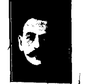
minister robót publicznych