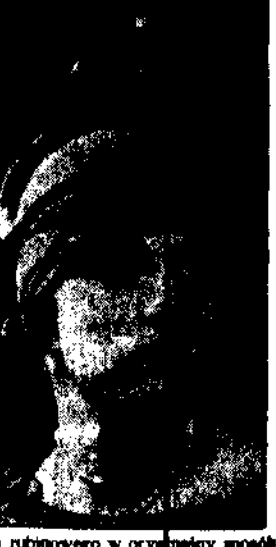
koloru rubinowego w oryginalny sposób przybrany kapelusz