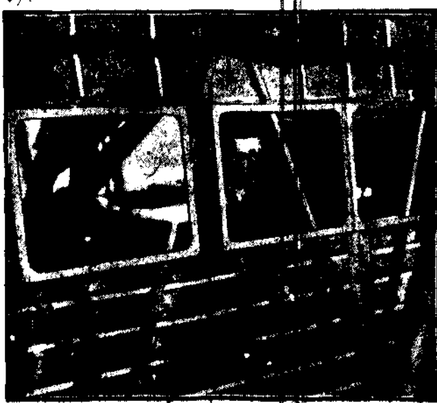
kpt. Font miał dokonać przelotu z Ameryki do Europy na aparacie tow. „Si-korskiv Corporation”. Samolot uległ katastrofie: przy starcie nastąpił wybuch benzyny, samolot opadł, a z płomieniami zginął cały załog.