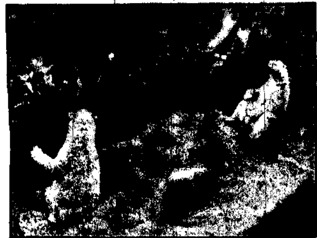
Białe niedzwiedzie w londyńskim ogródku zoologicznym aportują, za co publiczność darzy ich smacznościami kaskami.