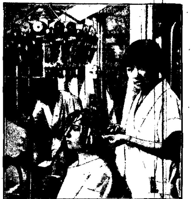
Nowoczesna fryzura kobieca spopularyzowała się nawet w Chinach. Cały szereg fryzjerek, wykształconych w Europie, strzyżę i onduluje swoje rodaczki.