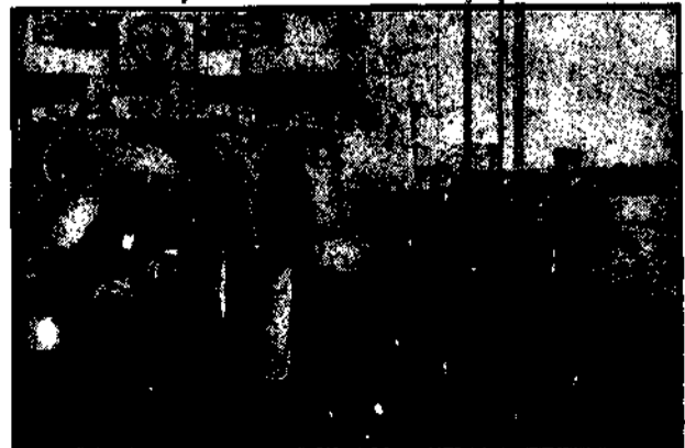
Amerykański krążownik „Memfis” zawiał na dzień dwa do portu kilpa. Komendant, Włk. sławił ziaris mianem „Alasce”.