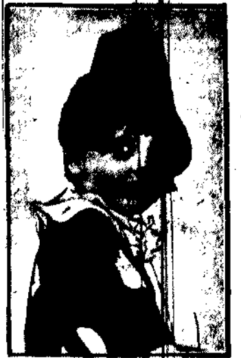
Jerzy Madon, najpiękniejsza gwiazda filmowa. Niedługo zobaczymy go na ekranie.