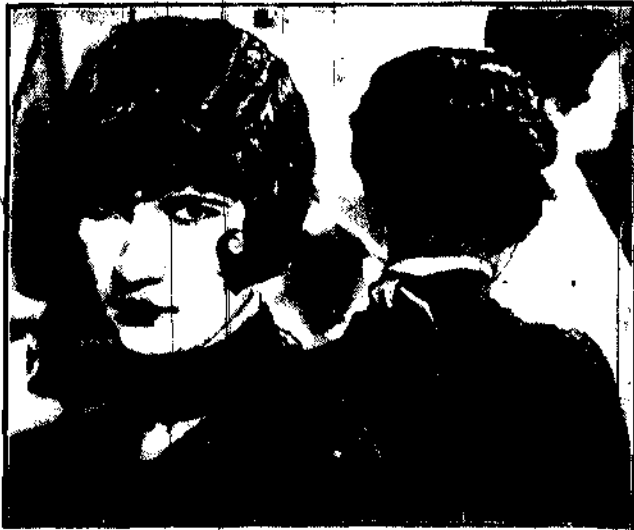
W Ameryce wprowadzono nową fryzurę główek z obciętymi włosami. Są one już dłuższe i więcej ondulowane, niż dotychczas.