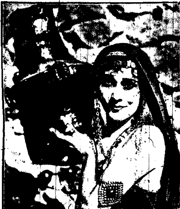
Men Morek, Arabka, pochodząca ze starego rodu, gra główną rolę w wielkim filmie wschodnim, obecnie nagracanym w Hollywood.