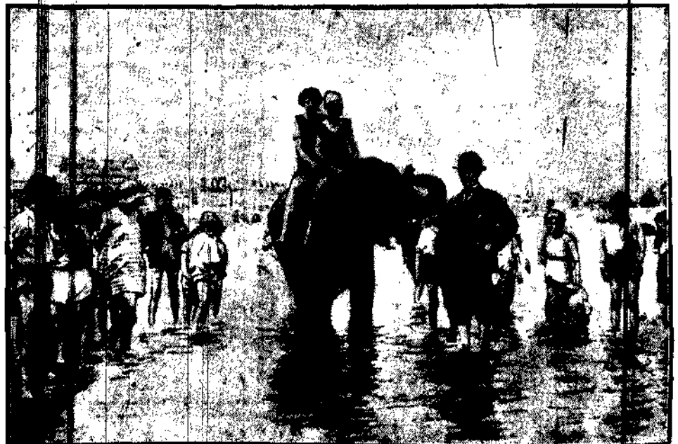
Na Riwierze największą atrakcją dla młodzieży był w ostatnim sezonie młody stół, na którym za parę franków można było przejechać się