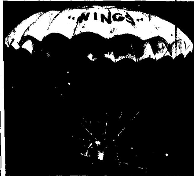
W Los Angeles dokonano doniosłego wynalazku, który ochroni samolot od katastrofy w razie jakiegokolwiek nieszczęśliwego wypadku podczas lotu. Na górnej powierzchni samolotu mieści się olbrzymich rozmiarów spadochron, który otwiera się automatycznie w chwili upadku i pozwala na powolną opuszczanie się samolotu na ziemię.