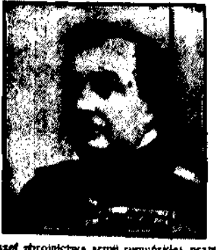
szef zbrojnicstwa armii rumuńskiej, przy był do Warszawy na czele delegacji zwiedzającej przemysł polski.