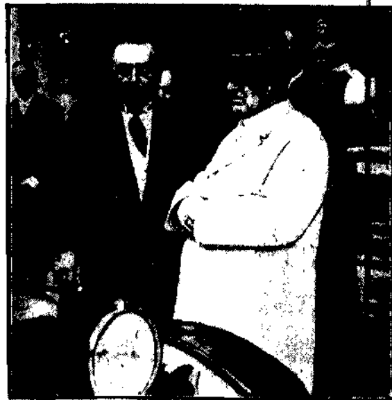
PAPIEŻ PIUS XI

z wielkim zainteresowaniem słucha objaśnień o postępiach w motobilizmie.