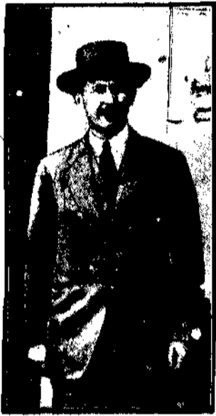
Minister kolei p. Paweł Romocki.

Wobec niepokojących wieści jakie dobiegają z różnych stron kraju o organizowaniu zdecydowanej akcji strajków kolejowych w sprawie poprawy bytu kolejarzy, zwrócił się do p. ministra Romockiego z pytaniem następującym: