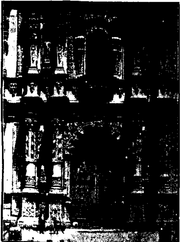
Kościół św. Ludwika, z powodu którego doszło do krwawych zamieszek pomiędzy zwolennikami ko-