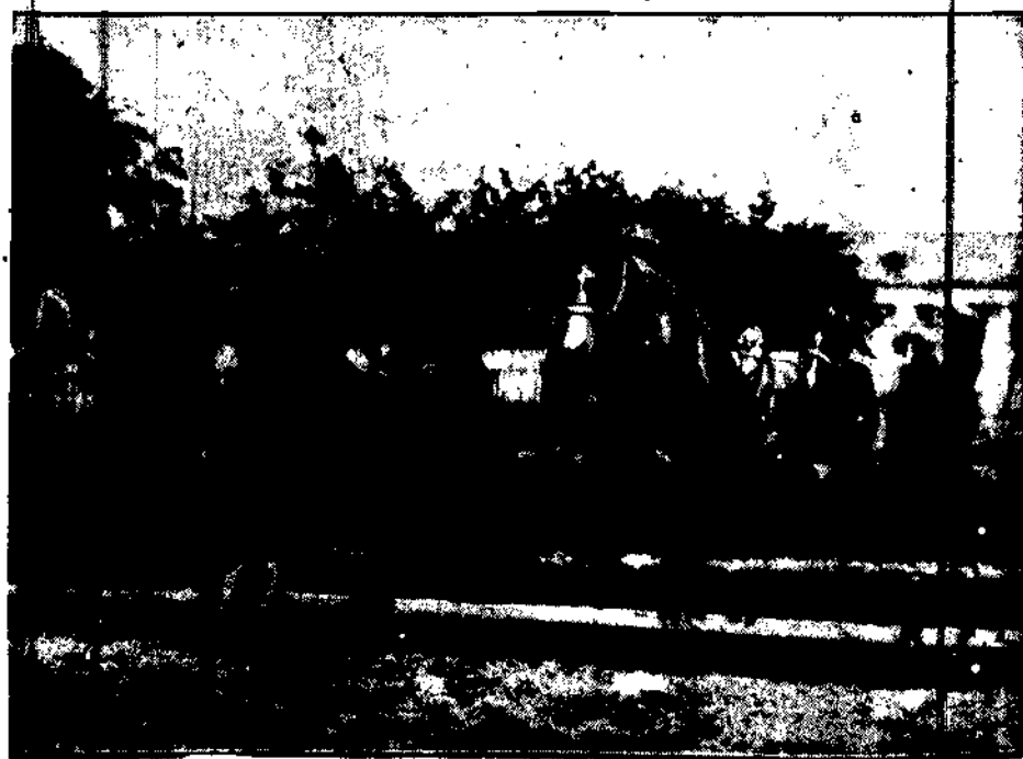
Fragment szkolenia koni w Odrze Kalwarii w t. sw. Zanisie koni