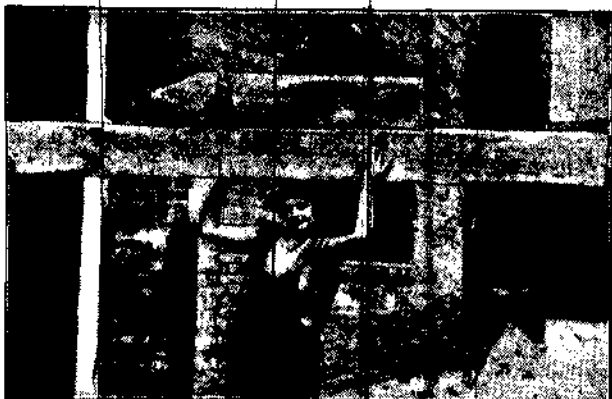
W Ameryce kobiety pod względem siły fizycznej zaczynają dorównywać mężczyznom. Fotografia nasza przedstawia robotnicę, dźwigającą bojkę długości 3,45 metr i o średnicy 30 cm.