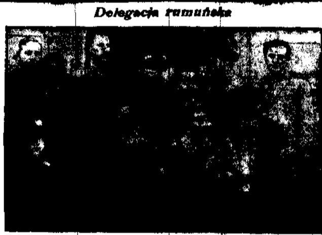
na ścianie Filii w Warszawie.

MOSKWA, 8.9. Krassin podał się do dymisji, prosząc Radę Komisarzy Ludowych o całkowite zwolnienie ze służby sowieckiej.