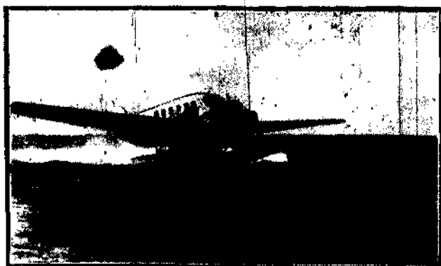
Hydroplan pasażerski polskiej linii lotniczej, który rozpoczął swoją próbną loty na linii powietrzno - morskiej: Puck — Kopenhaga