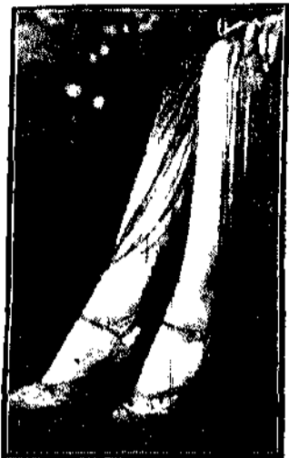
OSTAŃNIA MODA Wkracza jeszcze więcej nagości, wprowadzając do nich długie frędzle dla osłony nagości.

Złoczyńca ten był prawą ręką groźnego bandyty Rysia i nosił nawet miano adjutanta. Ryś stał na czele bandy Sobunkowej, która przez osiem lat, od r. 1918 do 1926 grasowała na terenie powiatu święciańskiego, na Wileńszczyźnie krwią i ogniem znacząc straszny szlak mordów, grabieży i napadów.