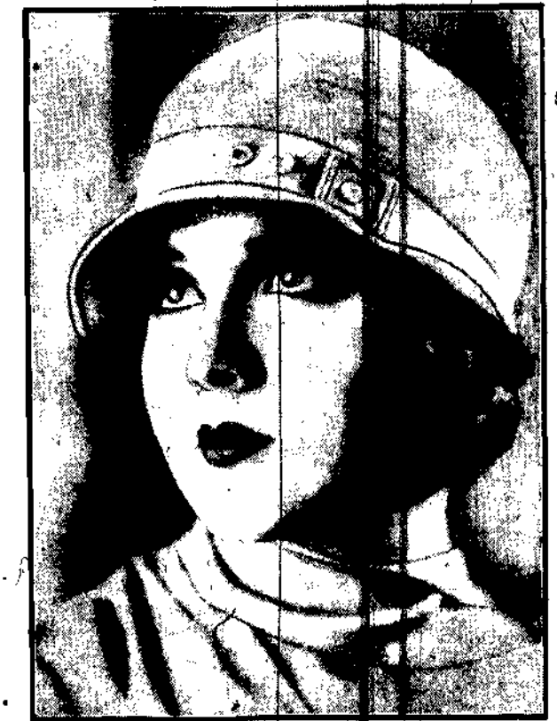
W Ameryce najpopularniejszą artystką.