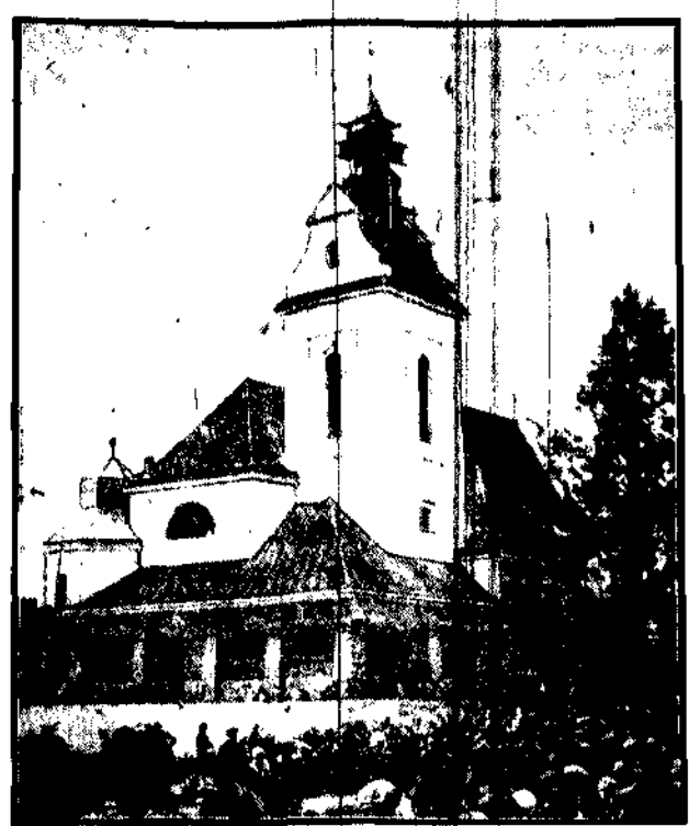
Piękny i oryginalny w swej elewacji kościół w Jazgarzewie pod wezwaniem św. Wawrzynca i św. Rocha.