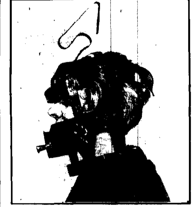
KARA NA PLOTKARKI

Staraniem niemieckiej policji kryminalnej zorganizowano w Berlinie międzynarodową wystawę re-trospektywną walki z przestępczością.