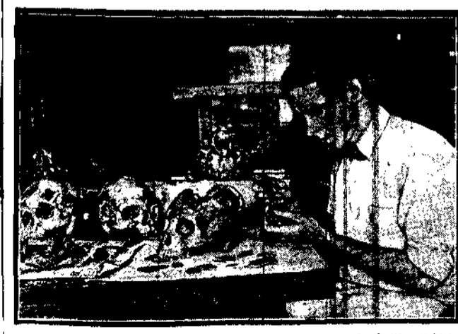
Amerkańska ekspedycja naukowa odkryła na wybrzeżach kalifornijskich... Amerykańsko po wymarłej jakiejś rasy indyjskiej jak to świadczyła odrobina, iż... odrobina cment... Odłupaniem zainteresowali się fremolozovia.