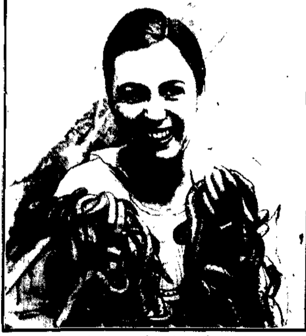
W Londynie wielką modą są węże, jako zwierzęta domowe. Istnieje specjalny... węża, która może być wężem kupować.