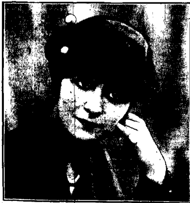
Kapciuk z czarnej bluzi, szarpane rękawy i szpileczki zakończone kulami.