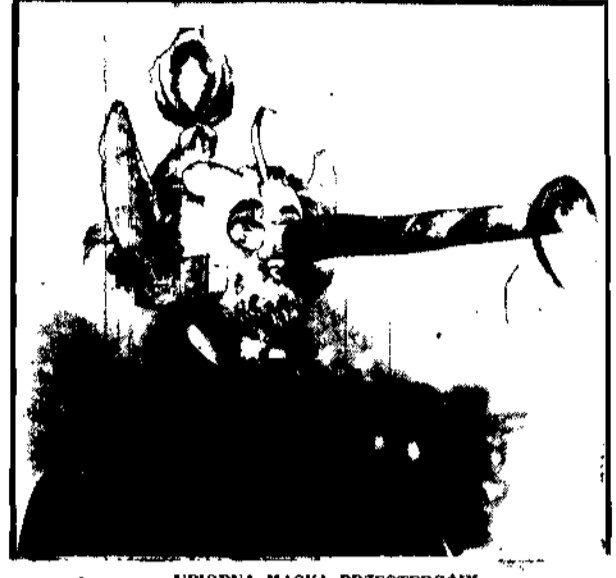
UPIORNA MASKA PRZESTĘPCÓW