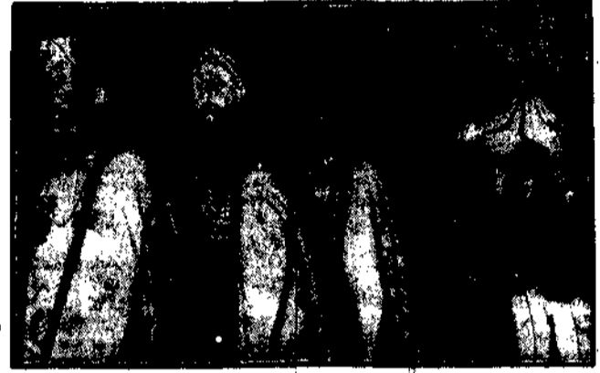
Przekazanie relikwii św. Stanisława Kostki z przysięgą na Wiślo do kościoła O.O. Jezuistów (patrz str. 2-ga)

WARSAWA, 28.8. O godz. 4 pp. w Przasnysku relikwie przebite uroczystie biskup płocki, poczem złożone będą w kościele parafialnym, miejscu chrztu św. Stanisława. Do Roskowa, wsi rodzinnej Patrona młodzieży, relikwie będą odprowadzone w uroczystej procesji jutro przed południem.