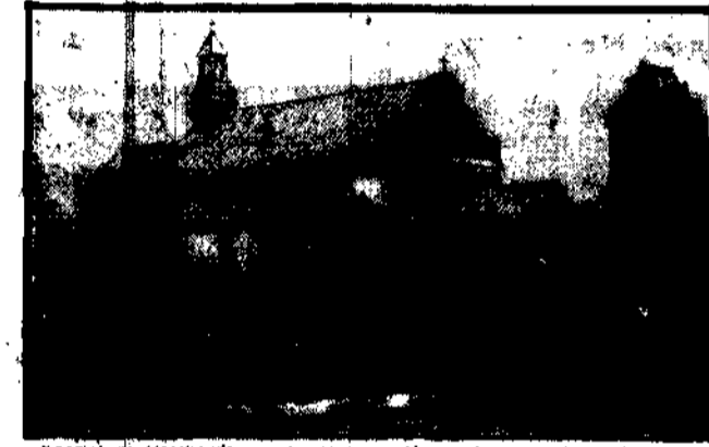
Kościół w Kosikowie, zbudowany na miejscu domu rodziny świętego

MOSKWA, 28.8. Po śniadaniu i krótkim wypoczynku por. Orliński o godz. 13 m. 25 odleciał do Kazania. MOSKWA 27.8. — Tel. wł. — Donoszą z Kazania: Dzisiaj o godzinie 6-ej po południu wylądował tu polski lotnik por. Orliński.