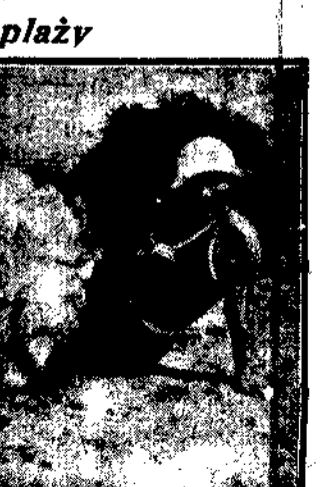
Relaksacja na plaży.