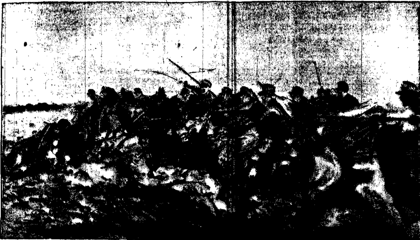
Brawurowemu natarciu jazdy polskiej, groźnej ongi i niezwyciężonej dziś -- nie oprze się żaden wróg i przeciwnik