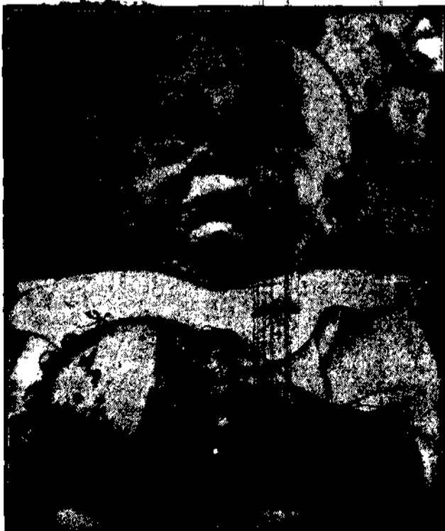
Bank na ul. Łezka kierując do objętywa. Na widok naszego lekarza, pacjentka się półtoraroczną pociechą, niekiedy...