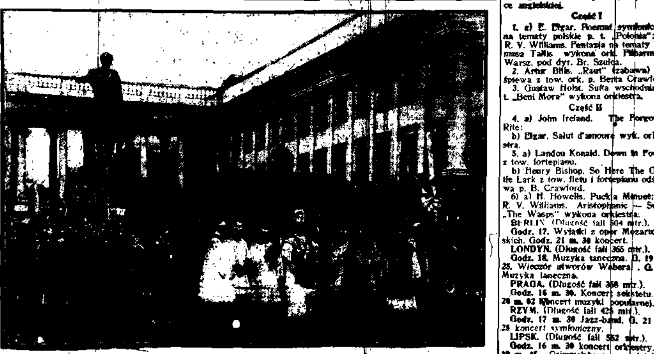
Minuta spóźnienia odroczyła pociąg, który 16.8. 1926 r.