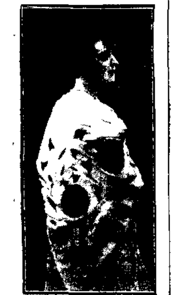
Pięknie haftowany szal stał się konieczny dla eleganckiej pani zarówno na przyjęciu, jak i w kościele.