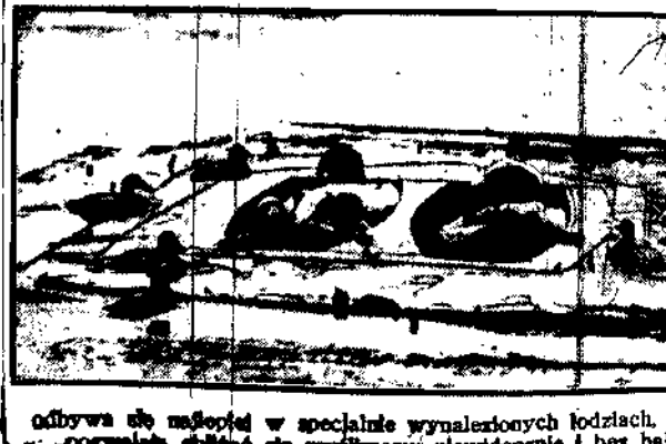
odbywa się nępcę w specjalnie wynalazionych łodziach, która w porcelanie służy do myślistwa i polowania na łosia.