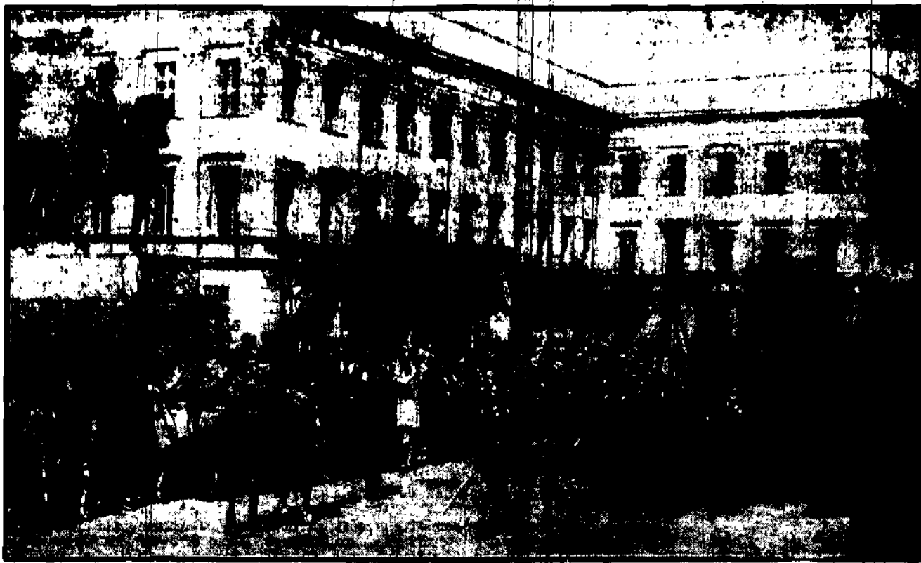
Punktem kulminacyjnym niedzielnych uroczystości była defilada wojsk i oddziałów przysposobienia wojskowego.

TABELA WIEKSIKICH WYGRANEJ 5-go DNIA CIĄGNIENIA 5-tej KLASY 12-ej LOTERJI PAŃSTWOWEJ Zł. 10.000 na n-ry: 18190 51313 62040. Zł. 2.000 na n-ry: 16193 35750. Zł. 1.000 na n-ry: 5253 6726 9799 14757 18469 46854. Zł. 600 na n-ry: 1966 9340 12253 21023 24618 41711 51102 54097 56883 61467 63660. Zł. 500 na n-ry: 4767 6104 11435 13969 14542 15873 23432 26548 29096 32179 34681 35777 37791 42744 43998 47311 48036 48833 50154 51293 54794 54413 57375 61672 68208. Zł. 400 na n-ry: 467 896 1383 2060 6481 11154 13337 17489 21531 24029 24263 27117 27462 37754 39006 39637 30751 32143 33751 34564 36353 39966 40807 42063 42600 46000 46447 51600 56488 56621 58285 60008 63220 63908 64117 64921.