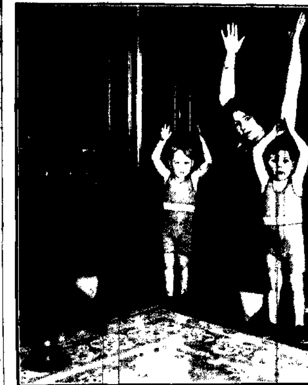
Rankiem amerykańska rodzina budzi głos radia: — Godzina 8-ma! Proszę wstać! Za 15 minut rozpoczynamy ćwiczenia.