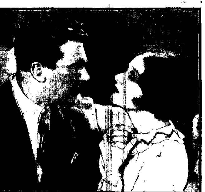
zobowiązani jako przyjaciele.