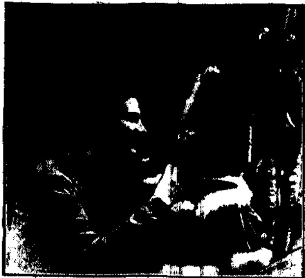
odbywa się narazie flirt z laloczką.