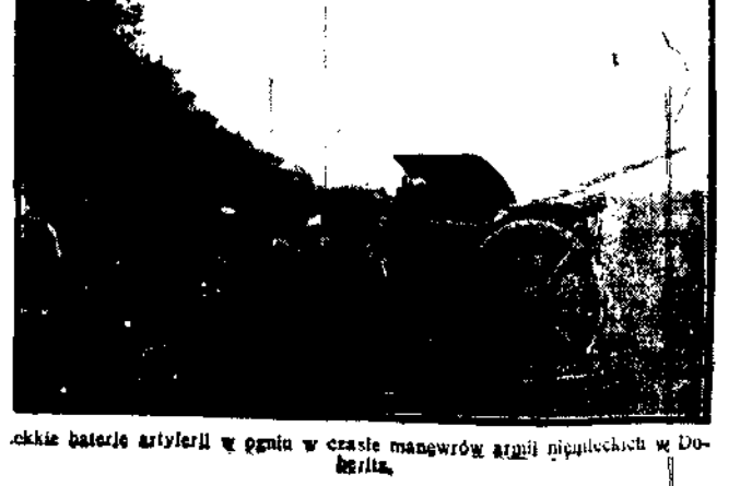
ciężkie baterie artylerji w garni w czasie manewrów armii niemieckich w Dobrzku.