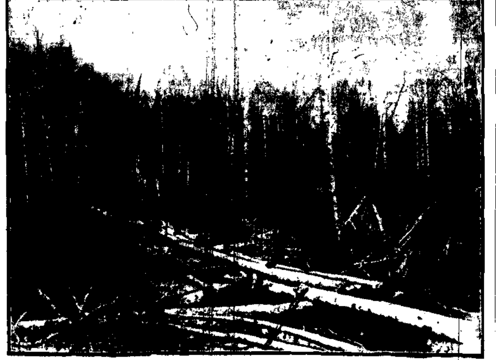
Kanał Północny przeznaczony do