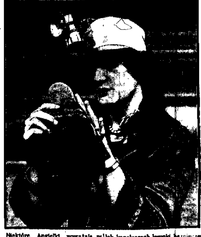
Niektóre Angielki wyrażają w ten sposób swoją sympatię dla strajku górników, że niosą za sobą...