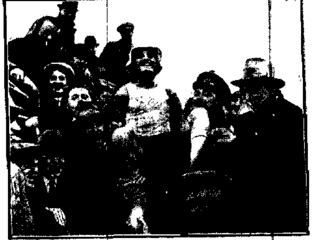
Są to wyścigi, które są rozgrywane osobno od 1916 roku; zwycięzca otrzymuje w nagrodę specjalny srebrny