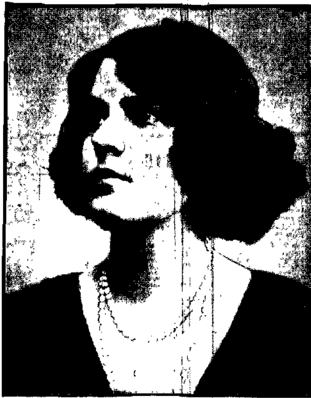
Zona znakomitego aktora amerykańskiego Johna Barrymore'a ma zamiar również poświęcić się karierze teatralnej. Jest ona znana a-