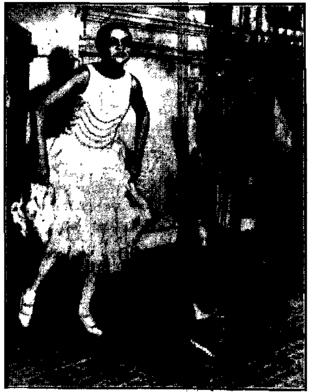
Amerykańska primadonna Florence Mills obwodziła, iż jest dla niej drobnotka, nęczyć psa mo- skiego charlestona.