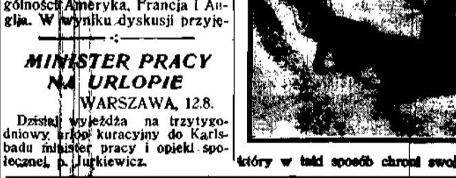
Na jednym z przedmiejskich placów Londynu podobało się nowego systemu ruchu ulicznego, który polega na tym, iż w pewnych punktach samochody, trągnęte przez kierowcę, ustają na chwilę, aby dać miejsce dla pieszych.