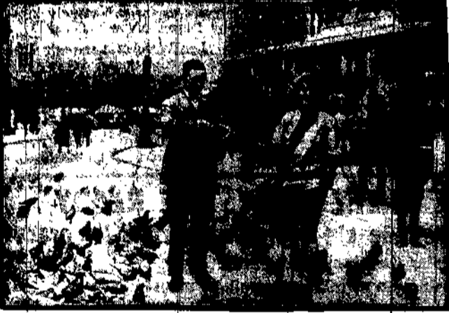
Katowanie zębów koło kościoła Mariackiego w Krakowie.