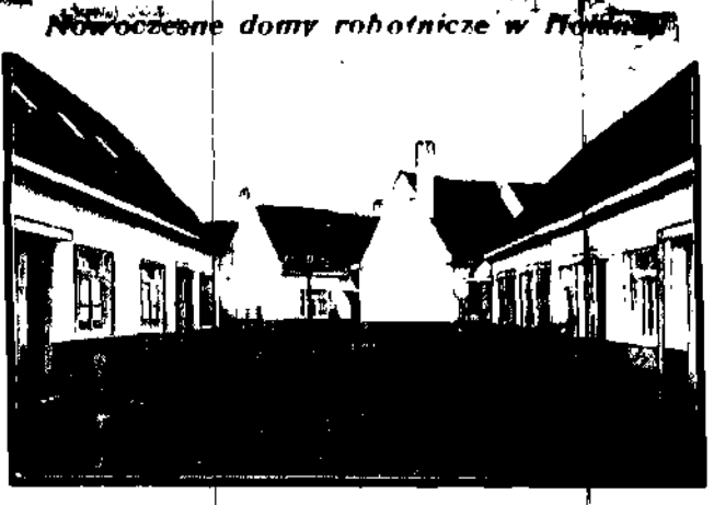
Nowoczesne domy robotnicze w Polsce