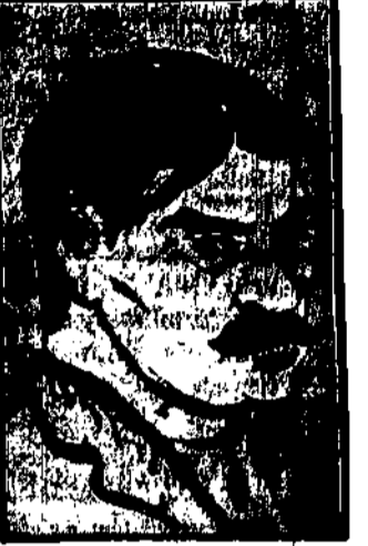
M. n. z. z. z.

Po śmierci królewskiego... Dzierżyńskiego szefem czczewczajki... sowieckiej mianowany został... Od r. 1895 brał on udział w ruchu bolszewickim. W r. 1918... generałem Moskwy w Borkach.