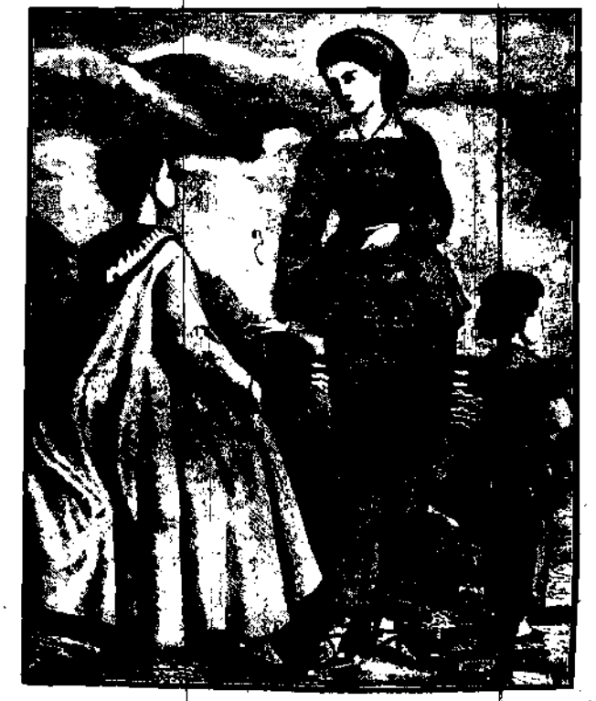
W takich strojach kąpały się niegdyś nasze prababki. W takich strojach chciałby również widzieć współczesne kobiety niektórzy nauki moralności.