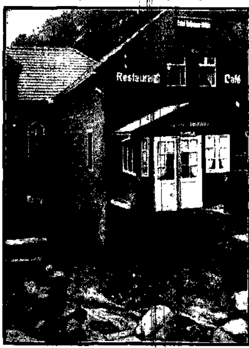
Dom ten niemal cały podmyła woda, rzucając wejście do restauracji