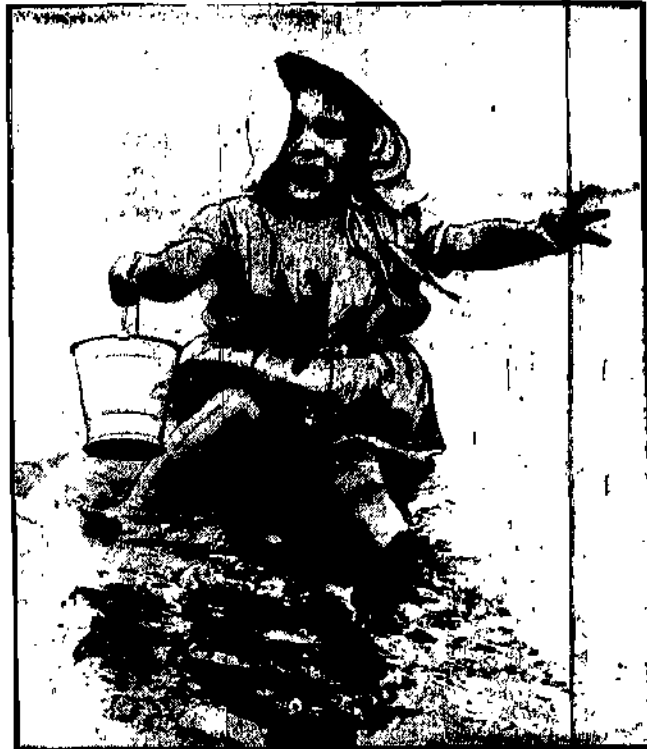
Ten mały chłopak posłizgnął się na piasku, chcąc zaczerpnąć wody.