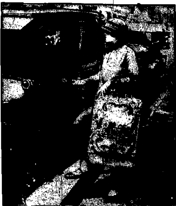
W takim wzroście można pół stopy zmieścić.