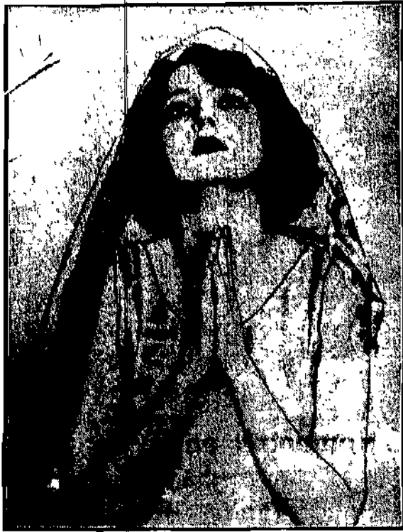
Imogen Wilson, gwiazda filmowa, podpisała obecnie kontrakt, na mocy którego będzie zarabiała 3.000 dolarów tygodniowo.