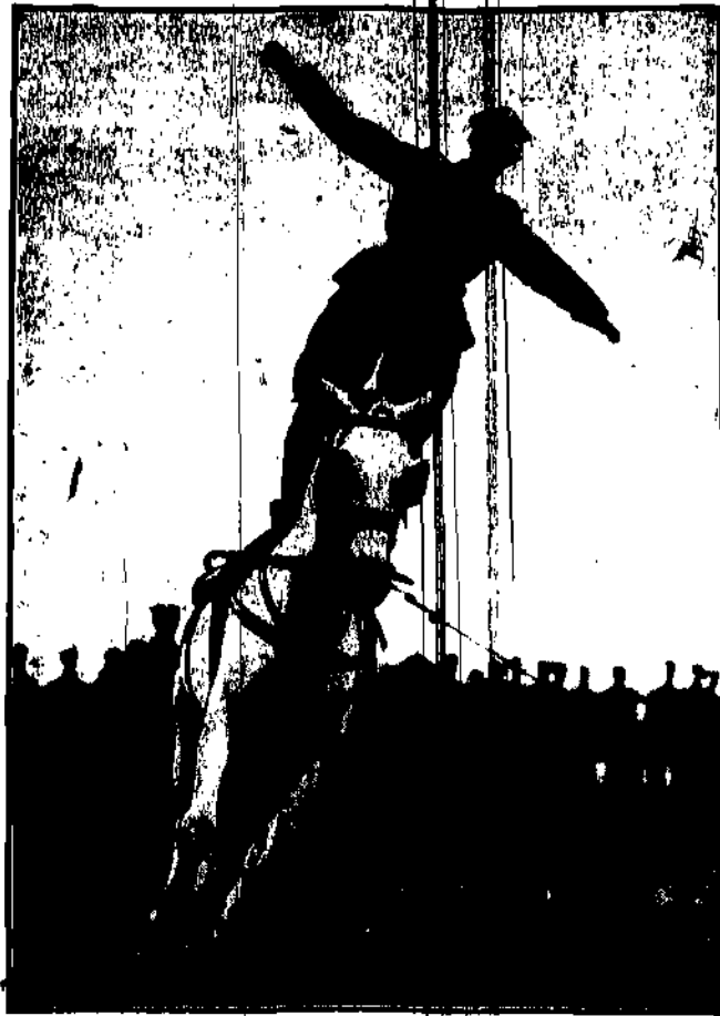
Z brawurą godną podziwu podchorąży Zaremba, zdobywca pierwszej nagrody na zawodach w Rambertowie, produkuje swój popisowy numer „stójka” na galopującym koniu.