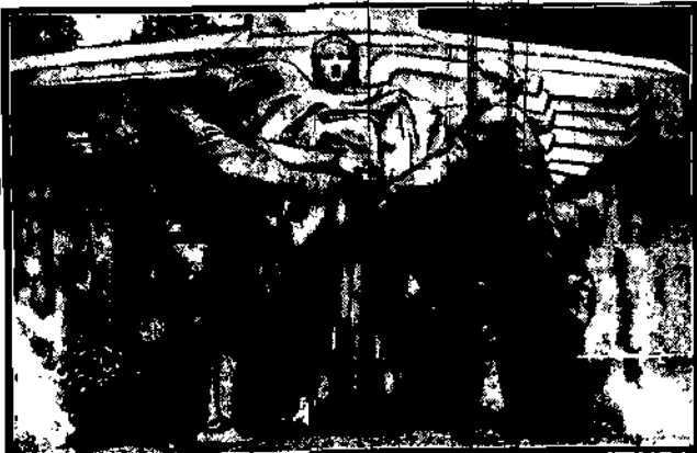
Słakt inżynier rosyjski, który sądził, że niebezpieczną polozenie finansowe Francji, jest dziełem Ameryki, dokonał aktu zemsty, niszcząc pomnik żołnie-rza amerykańskiego na placu Stanów Zjednoczonych. Batalion Rosjanu ode-grał rolę i samie kopiecy, tak to widzieli na swojej łupczy.