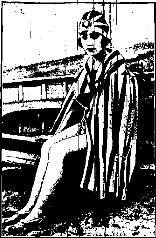
Widziany na plaży przy nadbrzeżu Japonii.