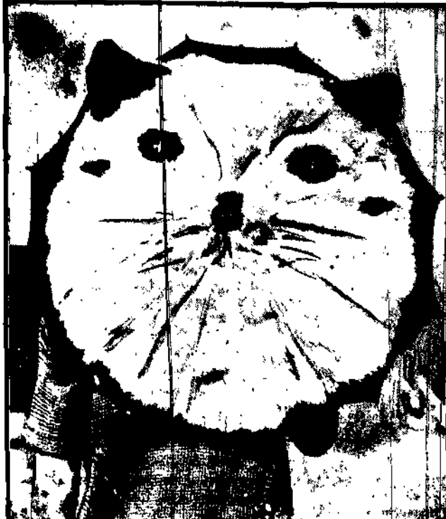
Aby wzmocnić użyć futer w lecie, wymyślono modę parasolek futer-nych.