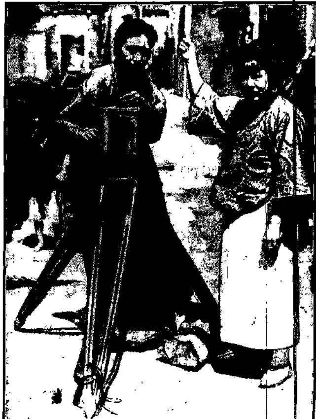
Jest młoda kobieta, która wychowała się w Stanach Zjednoczonych, a teraz wróciła do swej ojczyzny.