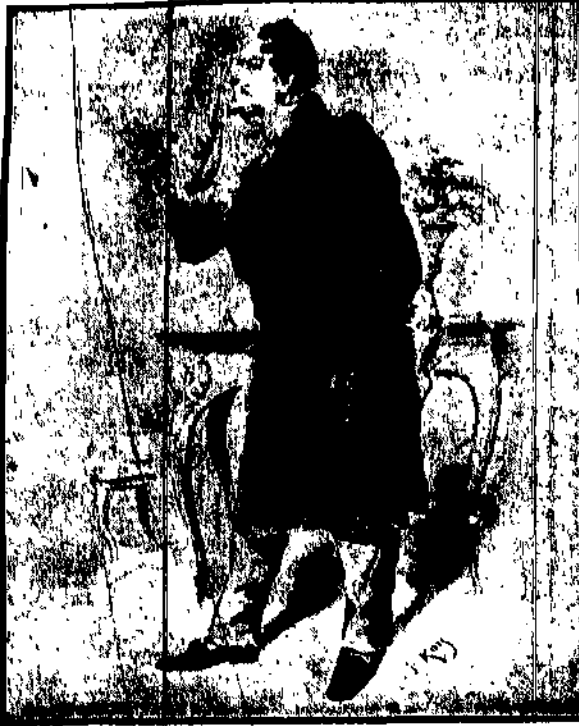
Oryginalny rysunek znanego amerykańskiego artysty, Franciszka Kozłowskiego.