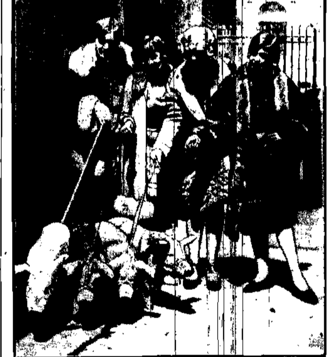
Oto cztery wesole panny amerykańskie ze swoimi najnowszymi ulubieńcami.