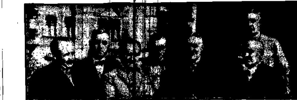
Wycieczka dziennikarzy warszawskich do portów i nad morze polskie. — podejmowana była z ogromną serdecznością przez działaczy polskich w Tczewie. Gdy ni i Gdańsku