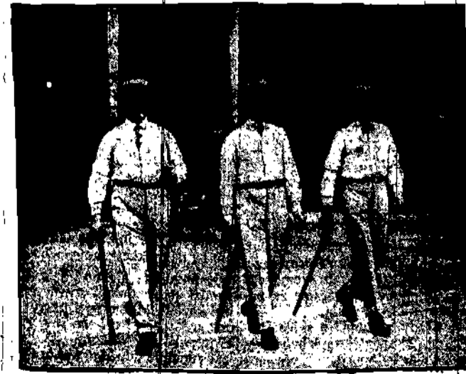
Nowa moda letnia dla panów.