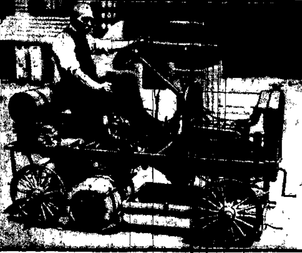
Włochy z Broctym wzięli nowy automatyczny...