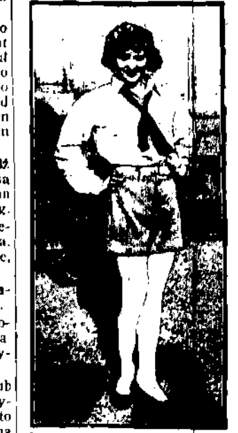
Ostatni model kostiumu, jakiego używała Amerykanka do spacerów nad morzem.