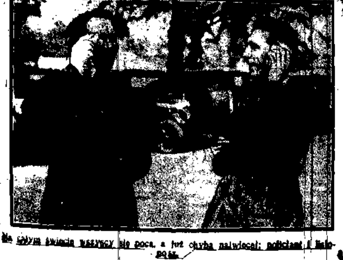
Na spójny świadcza wszyscy, że poca, a już chyba najwięcej; policjanci i...