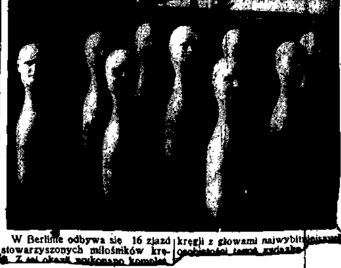
W Berlinie odbywa się 16 zjazd stowarzyszonych miłośników kręgli z głowami najwybitniejszych osobistości tegoż miasta. Z tej okazji wykonano komitet...