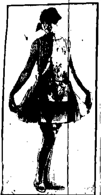
Model ubrania za przyzwolony przez amerykańskich cenatorów.