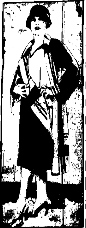
Oto amerykański model kostiumu sportowego z welnianego materiału zwącego się „kasha”.

Wieża Eiffla w Paryżu, wybudowana 37 lat temu, pozostaje mimo amerykańskich wysiłków.