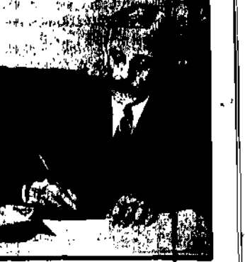
Minister skarbu Stanów Zjednoczonych przybył do Europy.