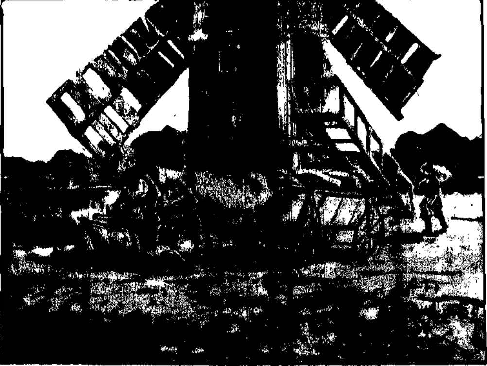
Pierwszy transport z mroźnej ziemi - Ziemi.