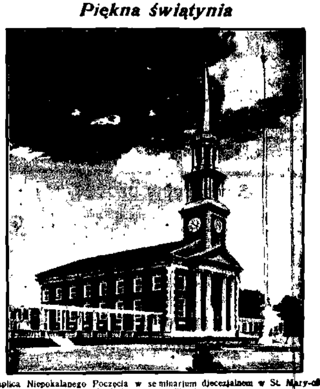
Kaplica Niepokalanego Poczęcia w seminarjum diecezjalnym w St. Mary-the Lake w stanie Illinois.

rywu dążeń, postępu i walki cywilizacji białej rasy bije potężną falą w brzegi spokojnej spokojem umierania Atryki, chce wchłonać w siebie jej duszę, — niezmierną, nieznana, beztroška lagunę i szaleć i walczyć, pedząc coraz dalej i dalej, od krańca i do krańca lału, niebaczną na to, czy nie się na pioropaszach swych fal — szczęście lub niedole? Dziękujcie więc mi, mili towarzysze, bo pokazałem wam Czarnego Czarownika, co ludzi zmienia w pantery, co umie zabijać i uzdrawiać, a który rzucił urok i na nasze dusze... Bo oto zapomnieliśmy już o plażach, które mi nas ścigał i nekął bez litości i z tęsknotą zwracamy teraz nasz wzrok tam, na dalekie południe, gdzie szumia korony drzew nad świątynią bogini Ziemi, gdzie potulni murzyni wysławiają obcego im Allacha i rodzinne gr-gri, gdzie męczeskie a szlachetne życie pedzą Francuzi, zwiastuni chrześcijańskiej cywilizacji, gdzie przebiegają dżungle stada bawołów i antylop, gonionych przez panterę i gdzie, niby namiętny, dzięki kochanek, Ocean, rozpiewany i gorący, usiłuje porwać piękną, słodko omdlewającą lagunę — swoje potężne ramiona. Warszawa, czerwiec 1926 (Koniec)