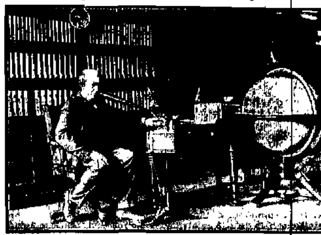
Detalowe zdjęcie Tomasa E. Edisona w jego laboratorium.