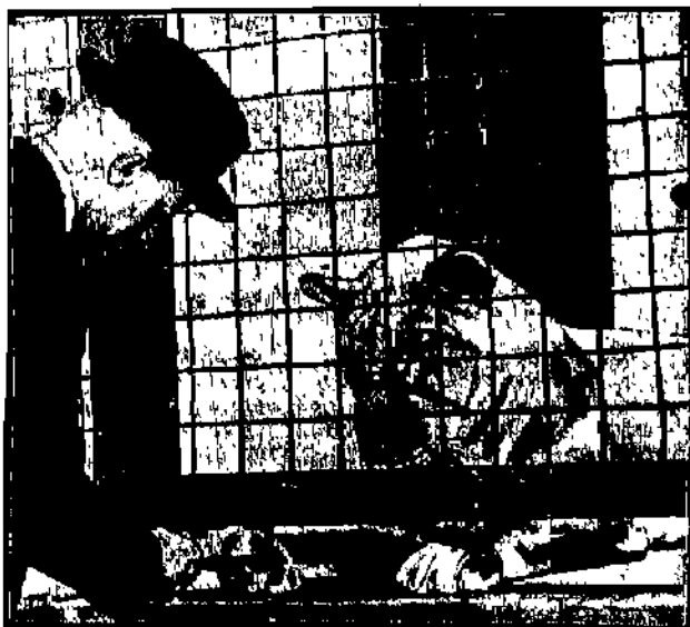
Królowa pedicury, włoska lwa w nowojorskim ośrodku zoologicznym, umiła podziwiać, podobnie do władcy świata, obdarzonych ludzką mową. Od czasu do czasu specjalny podkoczysta obcina jej pazurki.