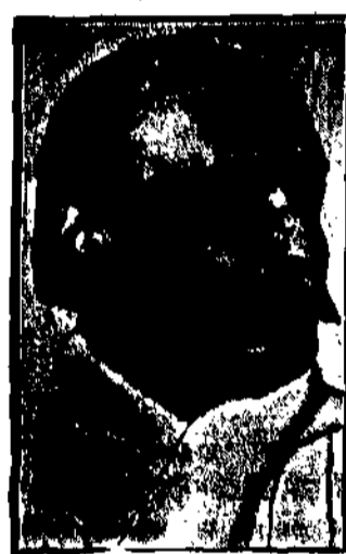
COURTELIN, nowy laureat francuski otrzymał wielką nagrodę Akademii francuskiej — 15,000 franków.