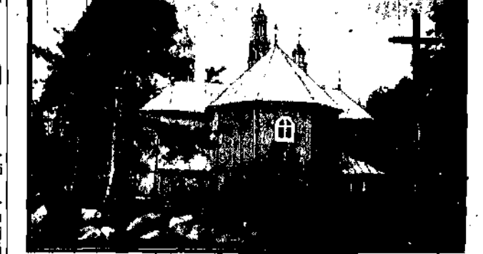
Kościółek drewniany w Eysych w pow. kolneńskim, jeden z najstarszych zabytków polskiego (1522 g.).