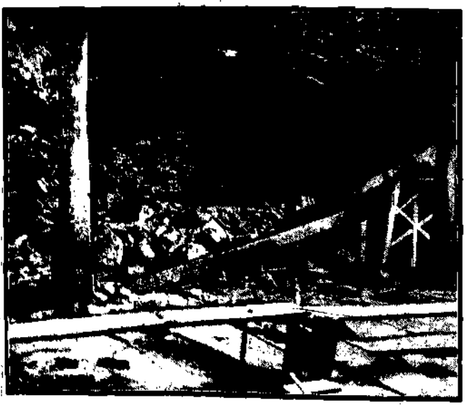
Straszliwa burza rozgromiła krótko, gdzie 13 osób smierć znalazło, a wielu było ciężko rannych.