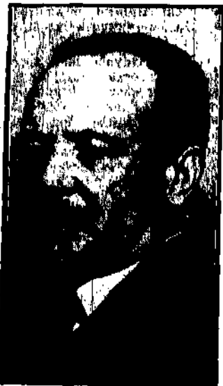
nowoimianowany minister oświaty ob- jął wczoraj urządowania.