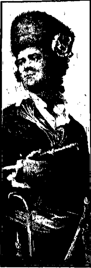
według starego szytelnij