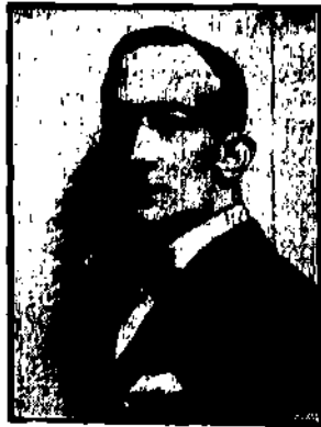
nieznanowany podsekretarzem stanu w m. skarb.