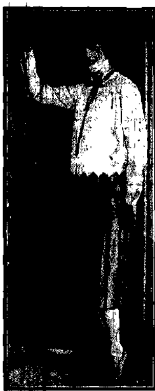
Strój popołudni. Spódniczka satynowa z wypustkami z czerwonej skóry, biała biała, rypsowa.