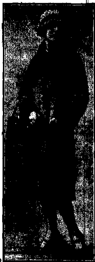
Plaszczyk wełniany niebieskawy z kolnierzem z futra królików.