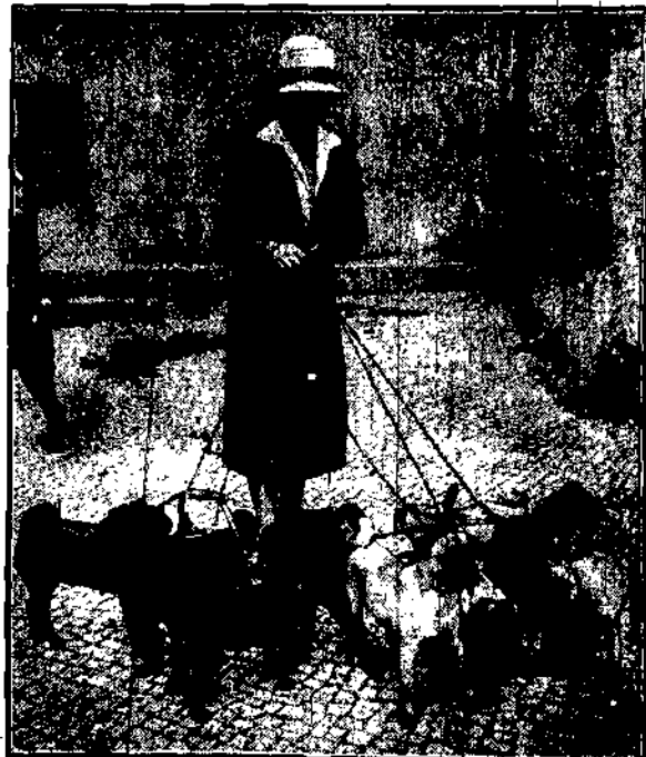
Lękawatorę przez hodowców mopsy zaczęli zyskiwać sympatię wśród miłośników. Na wystawie psów w Berlinie ukazały się nowe odmiany o spleczonych pyskach. Zdjęcie nasze wyobraża grupę, nagrodzoną listem pochwalnym.