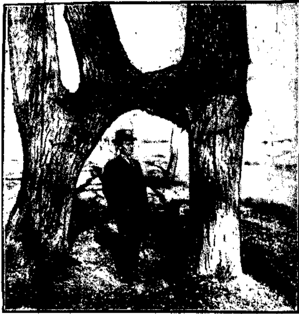
Te dwa drzewa ma swoją sensację: dwa drzewa z sobą zrosnięte — drzewa bliźniacze. Zrodziła je „ziemia sensacyjna” — Ameryka.