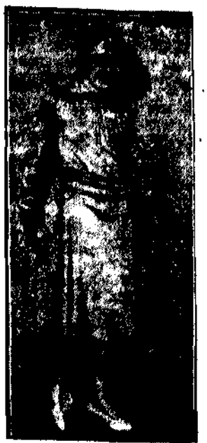
Letnia sukienka z szarego jedwabiu, ozdobiona potężnym pasem z srebrnymi sprzączkami. Kołnier i mankiety ze skóry kolory srebrnego. Do kompletu mały kapelusz, także srebrny.