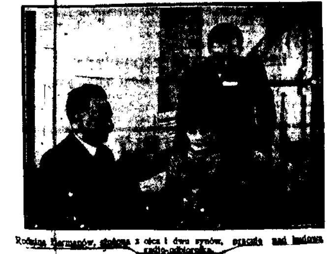
Radioamator, stojący z ołc i dwa syny, pracują nad budową radio-odbiorcy.