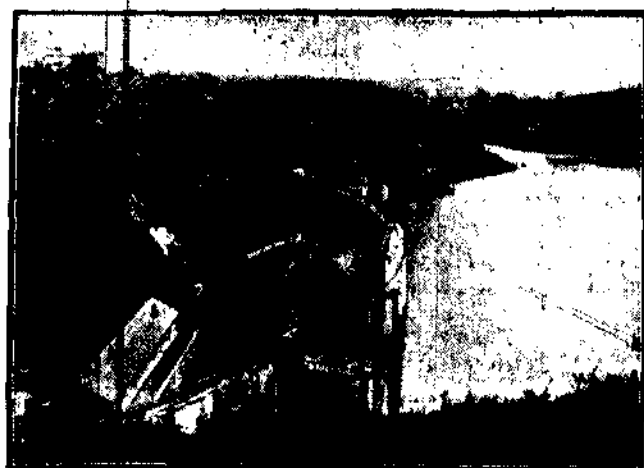
Obrzydła tama na rzece Creuse we Francji.

Skrzypce przyniosły mu sławę, majątek oraz królestwo cygańskie.