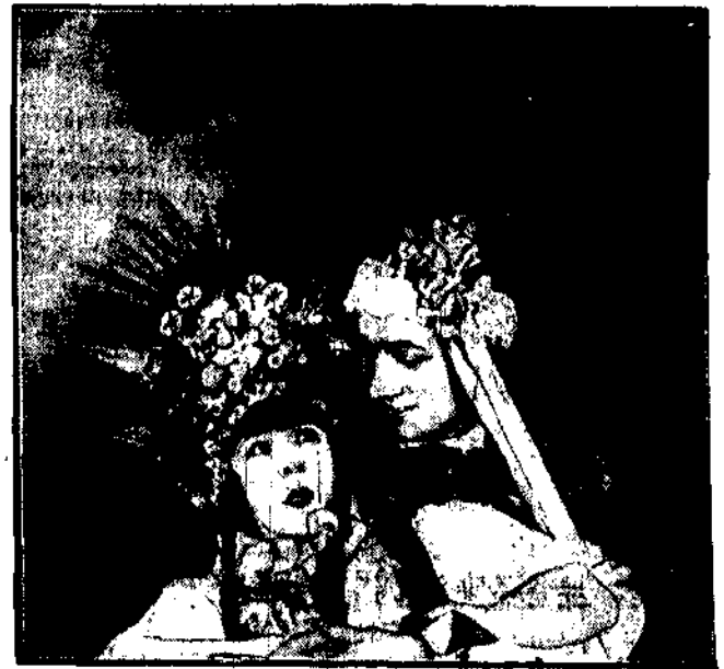
Paron i Pawłyszczewa ściska trumny oddających specjalnie w polskich teatrach w Paryżu w teatrze „Champs Elysee”.