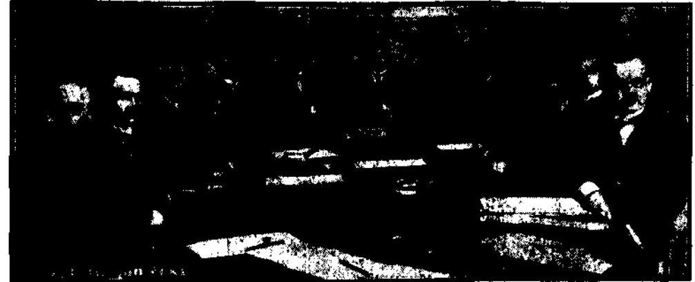
Siedzą od lewej ministrowie: Makowski (sprawiedliwość); Piłsudski (sprawy wojskowe); Prezydent Mościcki; premier Bartel; Młodzienowski (sprawy wewnętrzne); Zaleski (sprawy zagraniczne); Raczyński (rolnictwo); Mielonowski - Pomorski (okazja); Klarner (skarb); Kwiatkowski (handel); Brodzowski (roboty publiczne); Jurkiewicz (roboty publiczne).