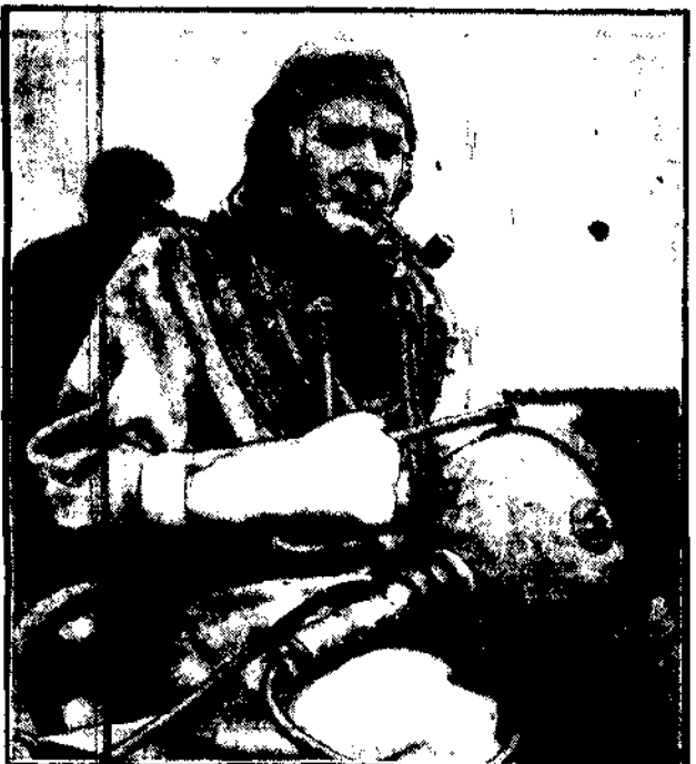
W takim „uzbrojeniu”, jak widzieliśmy powyżej, wędruje pod wodą nurek angielski, by na dnie oceanu

przygotować zatopioną korbę podwodną „S. 51” do wydobycia na powierzchnię.