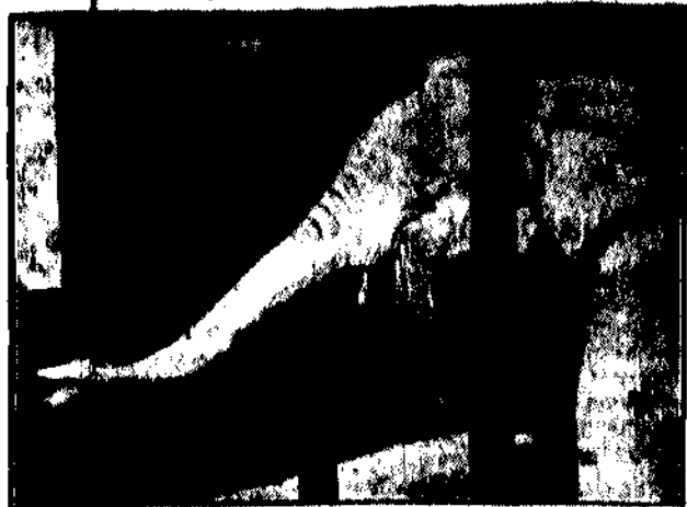
Ogrod paleontologiczny w Londynie otrzymał nowy nabytek. Przeważającym tematem z globu jest historia świata, który jako bardzo rzadki okaz znajdany tam jest za kwotę 2000 funtów.