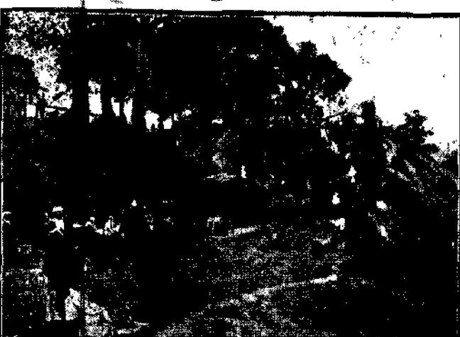
od strony przystani na Wiśle

20.000 osób przebyło wczoraj na Białym 25 parowców wiatrych, odbywają 175 kursów.