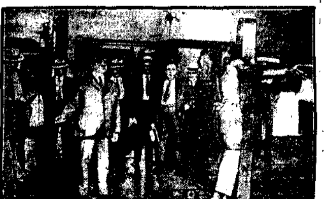
W Baltimore dokonano po raz pierwszy od 10 lat chłosty nad marnym, który zżęcał się nad żoną. Wykonawca wyroku był szeryf, który wymierzył mu 5 piaz w plec w obecności tłumy, liczącego około 200 osób.