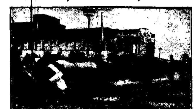
Na wystawie w Düsseldorfie kursuje ta lilipucia kolejka, obwoząc gości po terenie wystawy od jednego pawilonu do drugiego.