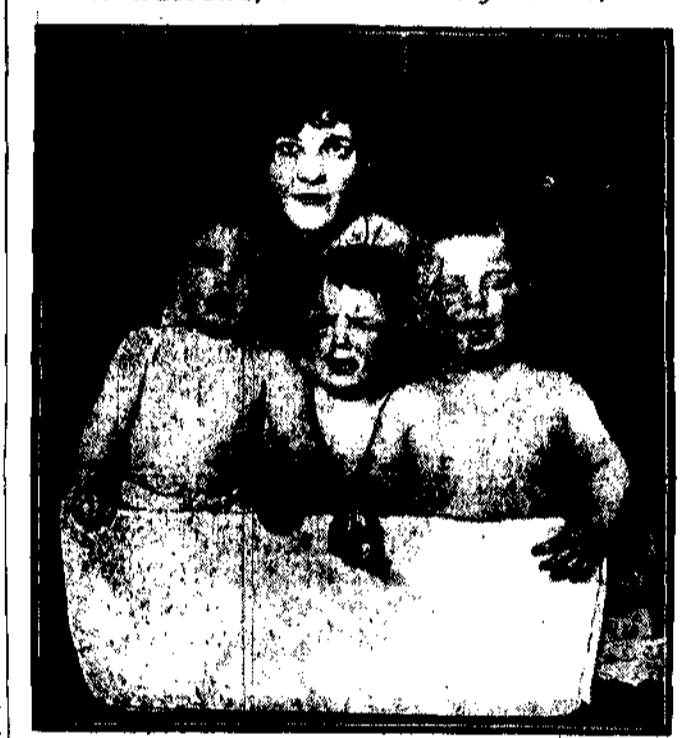
Biednych rodziców nie stać na to, aby zajmowali się wychowaniem własnych dzieci. Warunki żywcem grzesząca są równo oca jak i matka do pracy w fabryce lub w innym „businessie”. Coby robbity ich małżeństwa same wdowi, gdyż nie organizacje społeczne, które założyły w miastach amerykańskich oddziały ochrony dla dzieci pracujących rodziców. Niezle musi być dzieckiem pod opieką wykwalifikowanej pielęgniarki. Czyta 24, syta, w dobrych humorach.