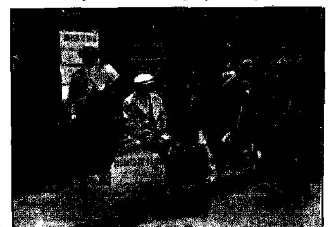
Paryscy śpiewacy operowi i operetkowi urządzają w „dniu franka” koncerty uliczne, po których sprządzali talony śpiewanych piosenek na cele kasz smieroty