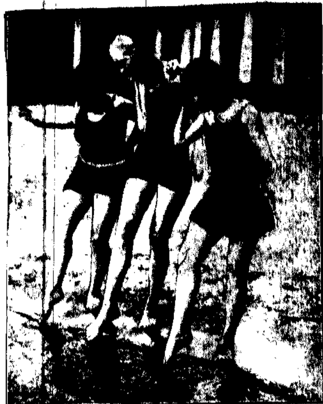
Jeżere daleko do świętego Jana, a już pojawiają się zapalone wioślarki wody, które próbują nózka, czy nie będzie jednak zbyt zimna, aby się w niej zanurzyć.