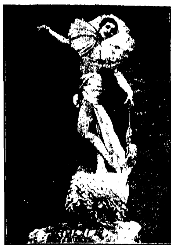
(Nbrzydkiem prowadzonym cetera się obawia w Paryżu występy tancerki La-blańskiej, o której wstę nie, że odcie pod król wybitna, rde polityczna za czarów pismarckich habsburskiej na Węgrzech. Nie wykazuje jednak na to słowiadko brzmienie jej nazwiska, ani znajomość stosunków przedwojennych.