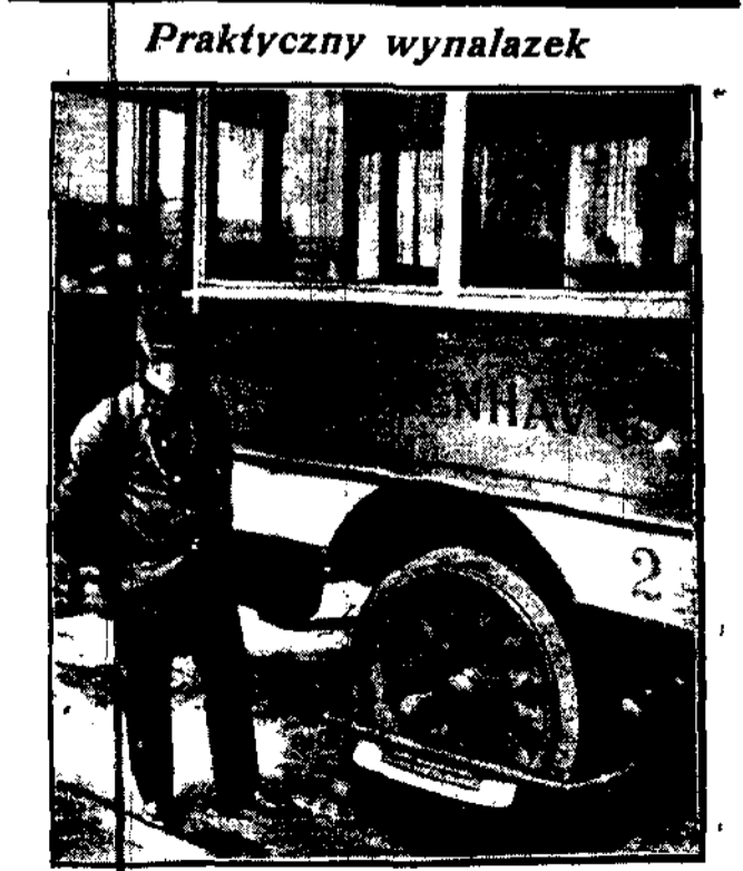
Autobusy kopenhaskie otrzymały ochraniacze błota zapobiegając rozpryskiwaniu błota przez koła. Ochranianą z taki w postaci szczyt...