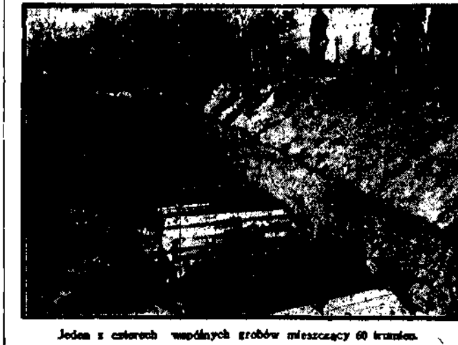
Jeden z czterech wspólnych grobów mieszczący 60 trumien.