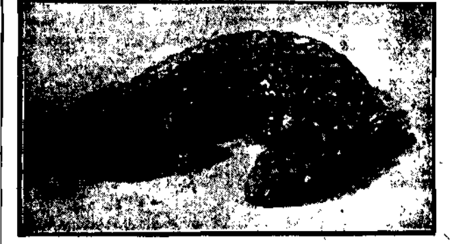
Jeden z niezwykłe ciekawych okazów bezowalnej zewnętrzny wykładem przypominająca slynka.