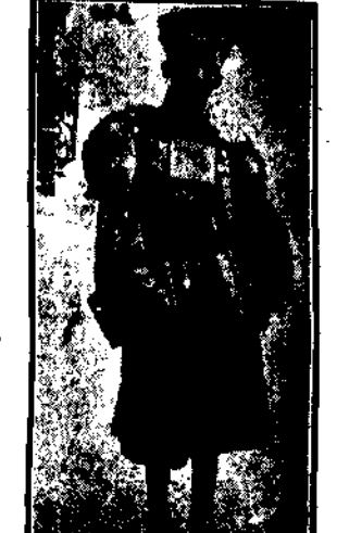
Wszystko co pachnie Rosją jest teraz do daty modne na Zachodzie. Oto kostjum damski na wzór czerkieski, cis szczyt się ogromnym powodzeniem w Paryżu.