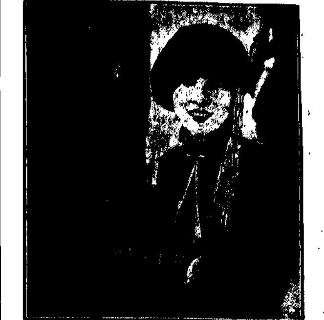
Amerykanka artystka filmowa nie rozstaje się nigdy ze swym peskiem, którego nosi za sobą w specjalnie na ten cel urządzonej torbie, zapakowanej z boku w okienko, którego dopływa powietrze.